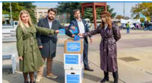
Miembros de CitizenGO en Ginebra, contra el Tratado sobre pandemias.

Así que llevamos más de 280.000 firmas para pedir a los delegados de todos los países su rechazo a este nuevo intento de control.