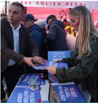
Miles de polacos protestan contra el envío de inmigrantes a su país.