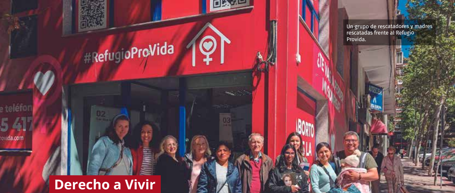
Un grupo de rescatadores y madres rescatadas frente al Refugio ProVida.