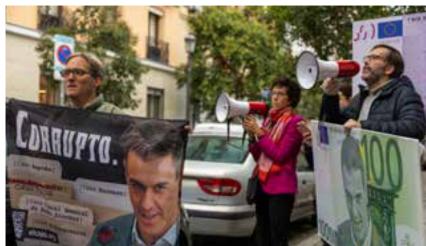
Manifestantes denunciando en los alrededores del Senado la corrupción de Sánchez.

Las imágenes de ese día hablan por sí solas: vallas, cordones policiales y ciudadanos apartados. Mientras dentro se hablaba de transparencia, fuera se levantaba un muro contra la crítica. Una paradoja que retrata mejor que cualquier discurso el momento político que vive España.