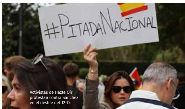
Activistas de Hazte Oír protestan contra Sánchez en el desfile del 12-O.