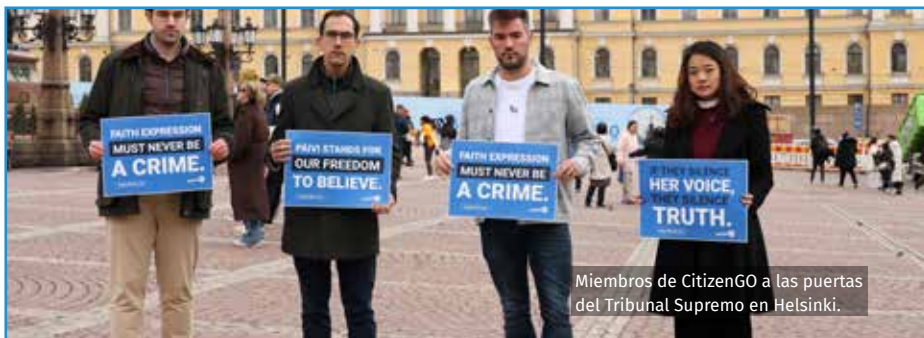
Miembros de CitizenGO a las puertas del Tribunal Supremo en Helsinki.