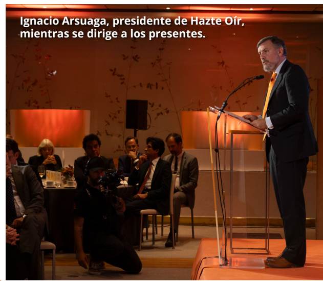
Ignacio Arsuaga, presidente de Hazte Oír, mientras se dirige a los presentes.