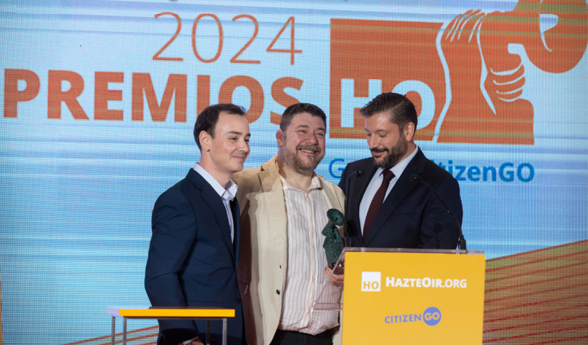
En 2024 no podíamos dejar de destacar a quienes han dado vida a las protestas en Ferraz contra el actual Gobierno.