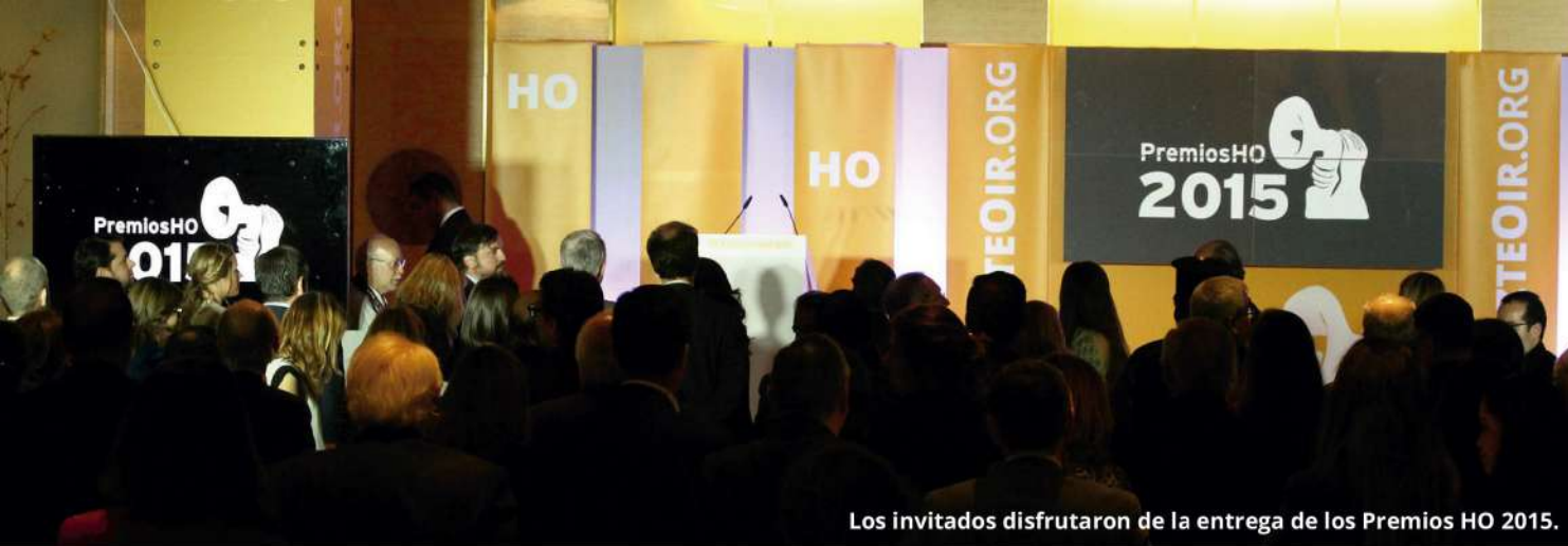
Los invitados disfrutaron de la entrega de los Premios HO 2015.