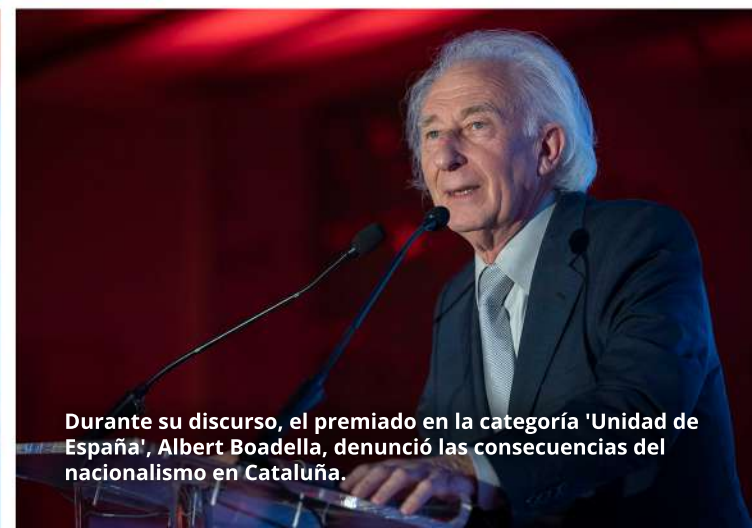
Durante su discurso, el premiado en la categoría 'Unidad de España', Albert Boadella, denunció las consecuencias del nacionalismo en Cataluña.