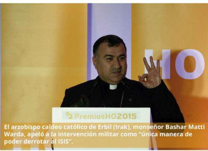
El arzobispo caldeo católico de Erbil (Irak), monseñor Bashar Matti Warda, apeló a la intervención militar como "única manera de poder derrotar al ISIS".