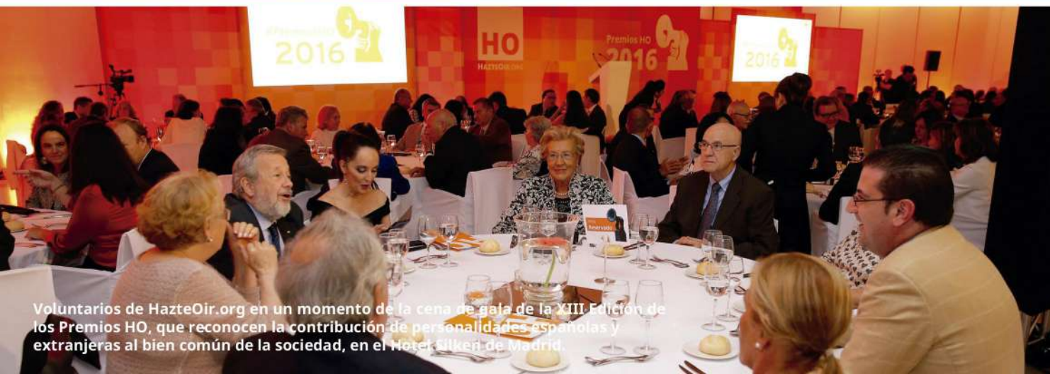
Voluntarios de HazteOir.org en un momento de la cena de gala de la XIII Edición de los Premios HO, que reconocen la contribución de personalidades españolas y extranjeras al bien común de la sociedad, en el Hotel Silken de Madrid.