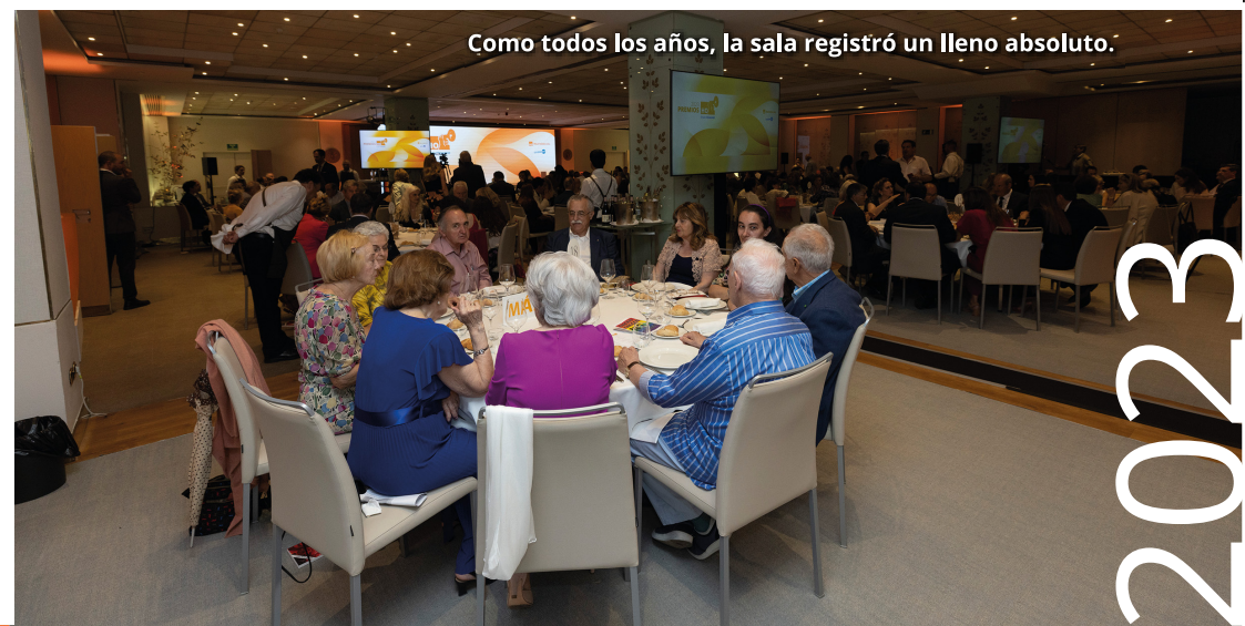
Como todos los años, la sala registró un lleno absoluto.