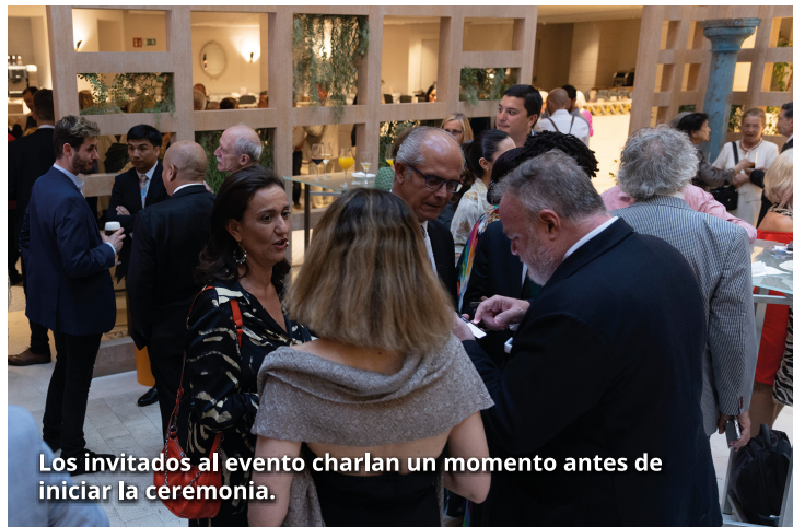
Los invitados al evento charlan un momento antes de iniciar la ceremonia.