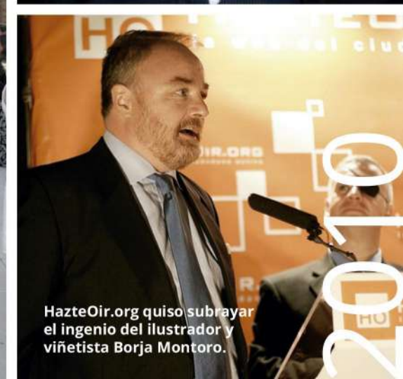
HazteOir.org quiso subrayar el ingenio del ilustrador y viñetista Borja Montoro.