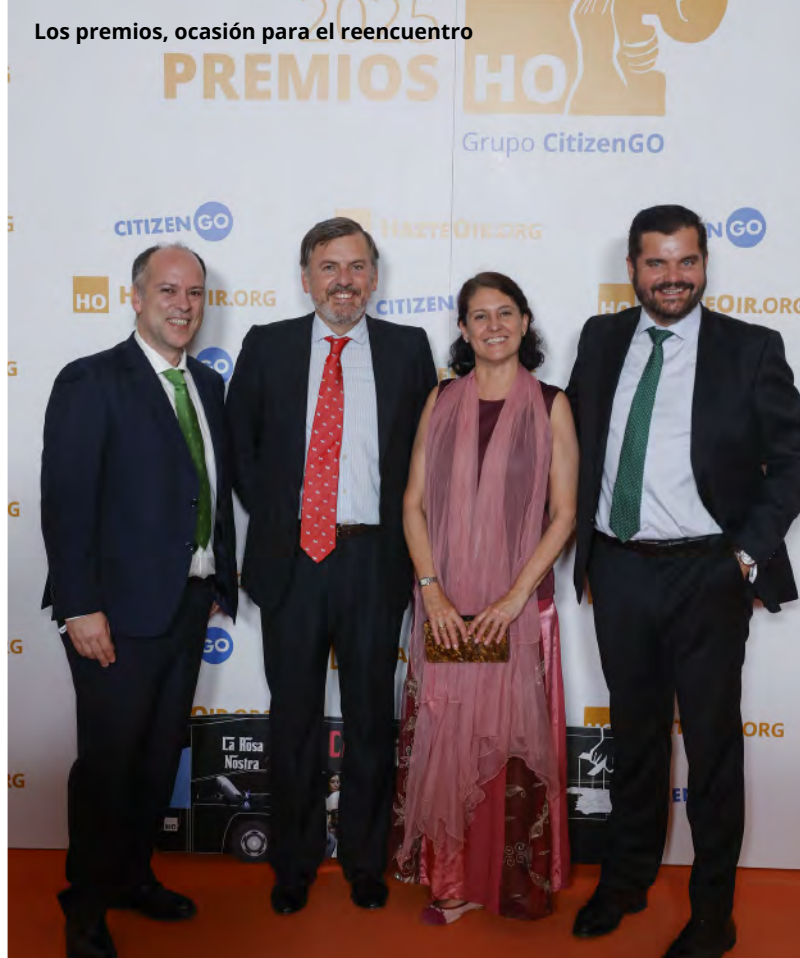
Los premios, ocasión para el reencuentro