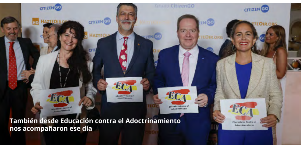
También desde Educación contra el Adoctrinamiento nos acompañaron ese día