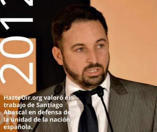
HazteOir.org valoró el trabajo de Santiago Abascal en defensa de la unidad de la nación española.