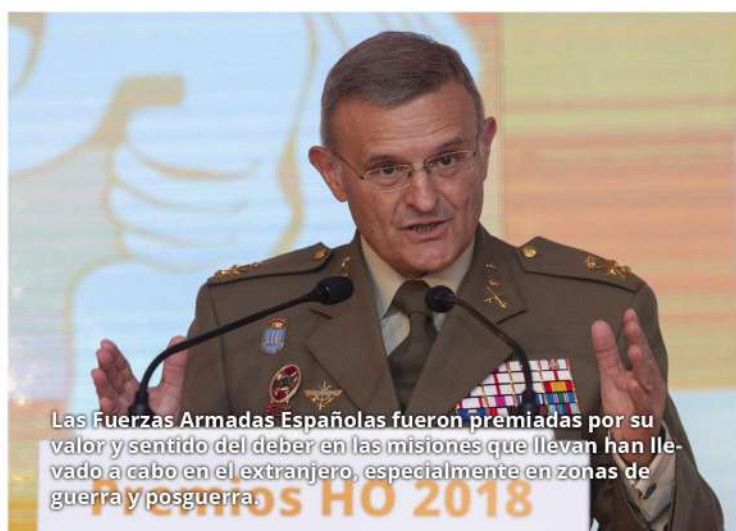
Las Fuerzas Armadas Españolas fueron premiadas por su valor y sentido del deber en las misiones que llevan han llevado a cabo en el extranjero, especialmente en zonas de guerra y posguerra.