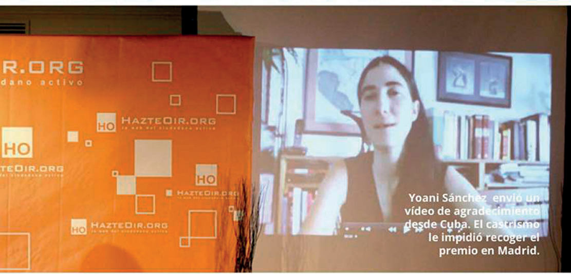
Yoani Sánchez envió un vídeo de agradecimiento desde Cuba. El castrismo le impidió recoger el premio en Madrid.