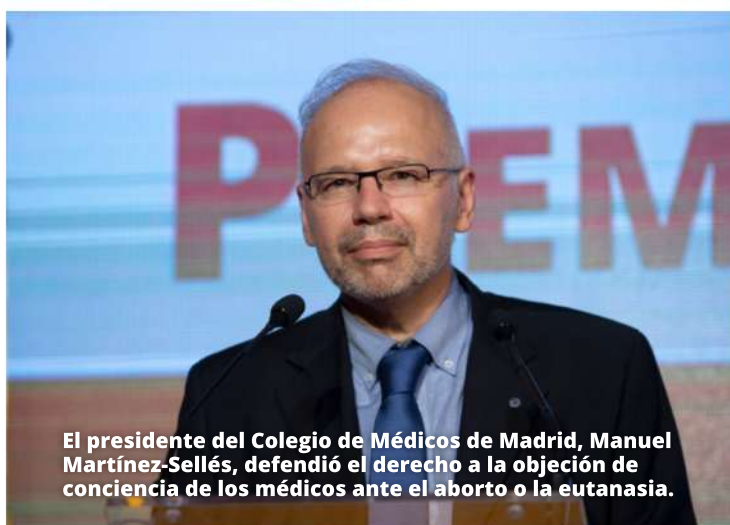
El presidente del Colegio de Médicos de Madrid, Manuel Martínez-Sellés, defendió el derecho a la objeción de conciencia de los médicos ante el aborto o la eutanasia.