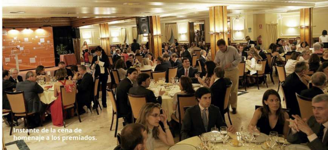
Instante de la cena de homenaje a los premiados.