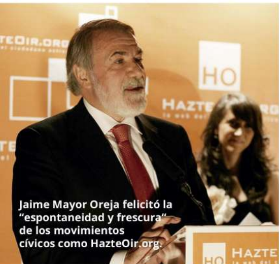
Jaime Mayor Oreja felicitó la "espontaneidad y frescura" de los movimientos cívicos como HazteOir.org.