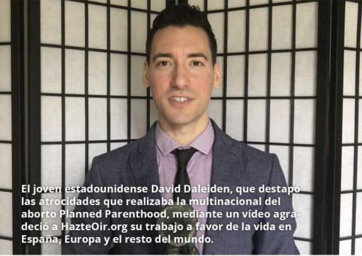
El joven estadounidense David Daleiden, que destapó las atrocidades que realizaba la multinacional del aborto Planned Parenthood, mediante un vídeo agradeció a HazteOir.org su trabajo a favor de la vida en España, Europa y el resto del mundo.