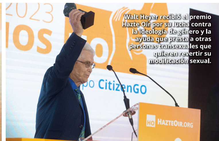
Walt Heyer recibió el premio Hazte Oír por su lucha contra la ideología de género y la ayuda que presta a otras personas transexuales que quieren revertir su modificación sexual.