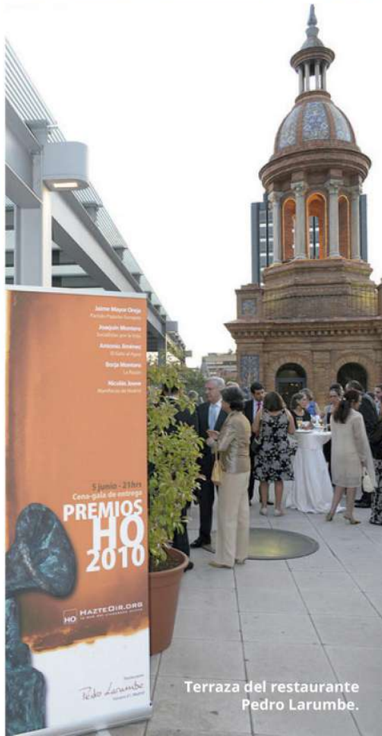
Terraza del restaurante Pedro Larumbe.