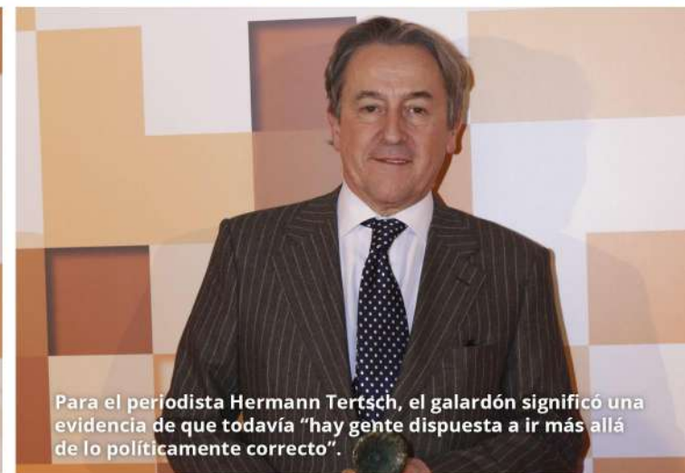
Para el periodista Hermann Tertsch, el galardón significó una evidencia de que todavía "hay gente dispuesta a ir más allá de lo políticamente correcto".