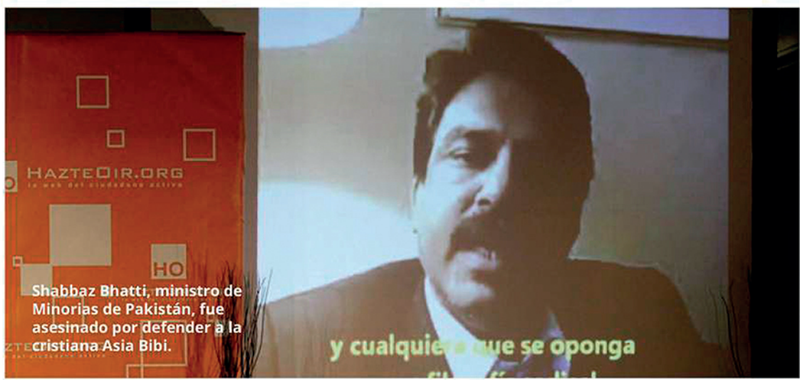
Shabbaz Bhatti, ministro de Minorías de Pakistán, fue asesinado por defender a la cristiana Asia Bibi.