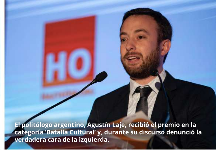
El politólogo argentino, Agustín Laje, recibió el premio en la categoría 'Batalla Cultural' y, durante su discurso denunció la verdadera cara de la izquierda.