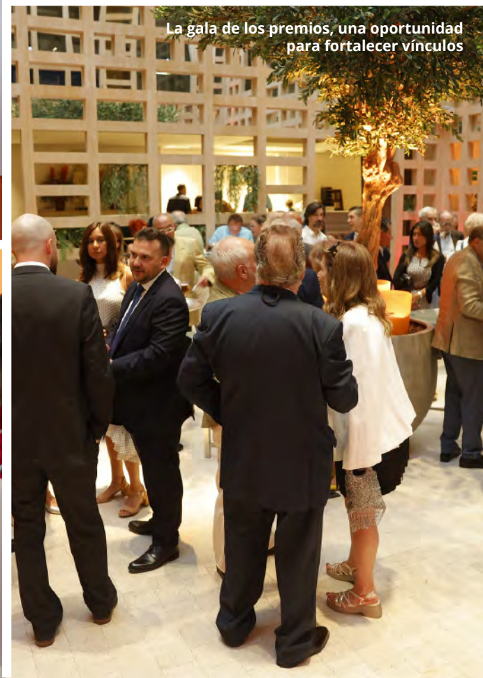
La gala de los premios, una oportunidad para fortalecer vínculos