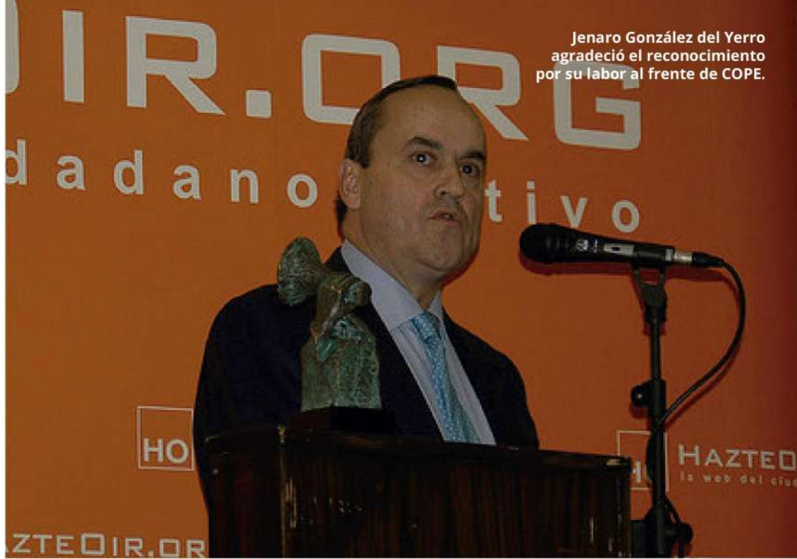
Jenaro González del Yerro agradeció el reconocimiento por su labor al frente de COPE.