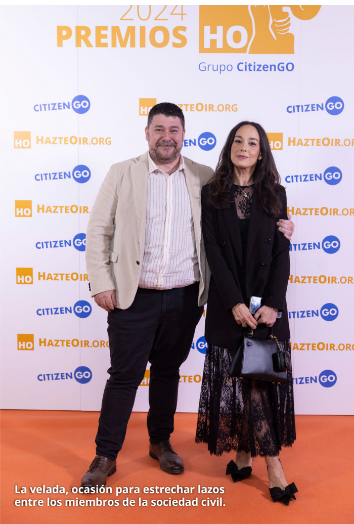
La velada, ocasión para estrechar lazos entre los miembros de la sociedad civil.