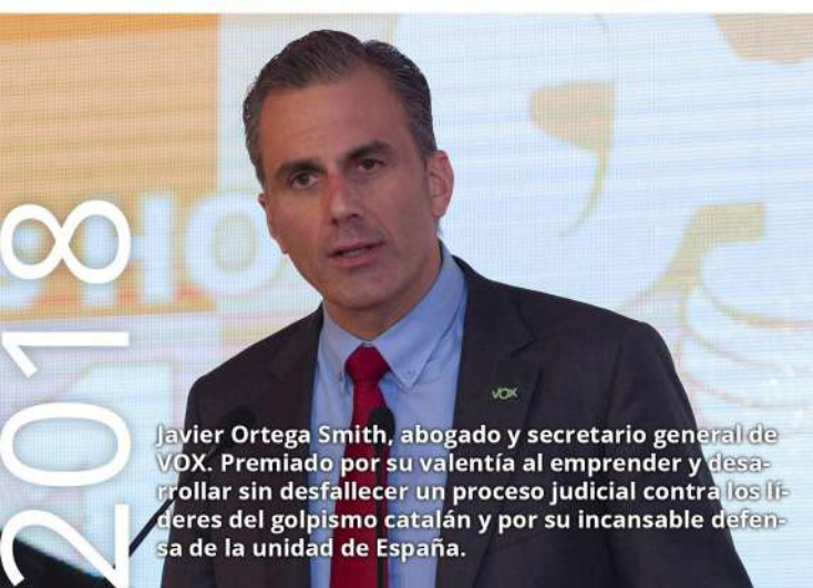
Javier Ortega Smith, abogado y secretario general de VOX. Premiado por su valentía al emprender y desarrollar sin desfallecer un proceso judicial contra los líderes del golpismo catalán y por su incansable defensa de la unidad de España.