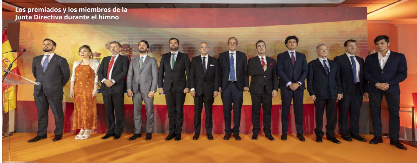
Los premiados y los miembros de la Junta Directiva durante el himno