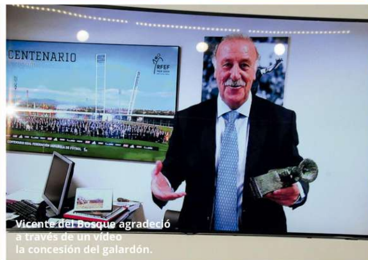
Vicente del Bosque agradeció a través de un video la concesión del galardón.