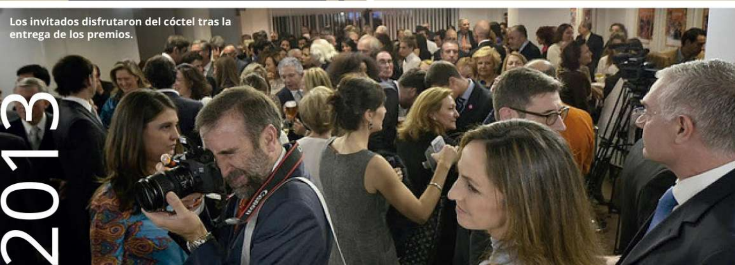
Los invitados disfrutaron del cóctel tras la entrega de los premios.