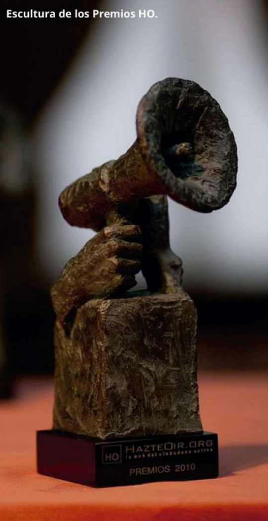
Escultura de los Premios HO.