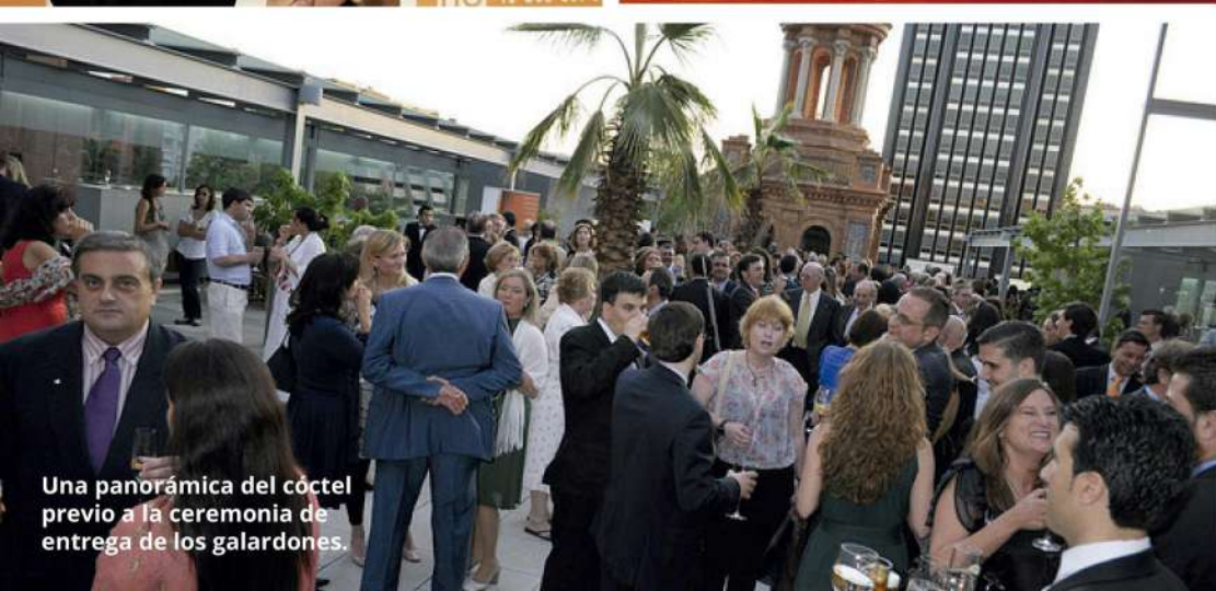
Una panorámica del cóctel previo a la ceremonia de entrega de los galardones.