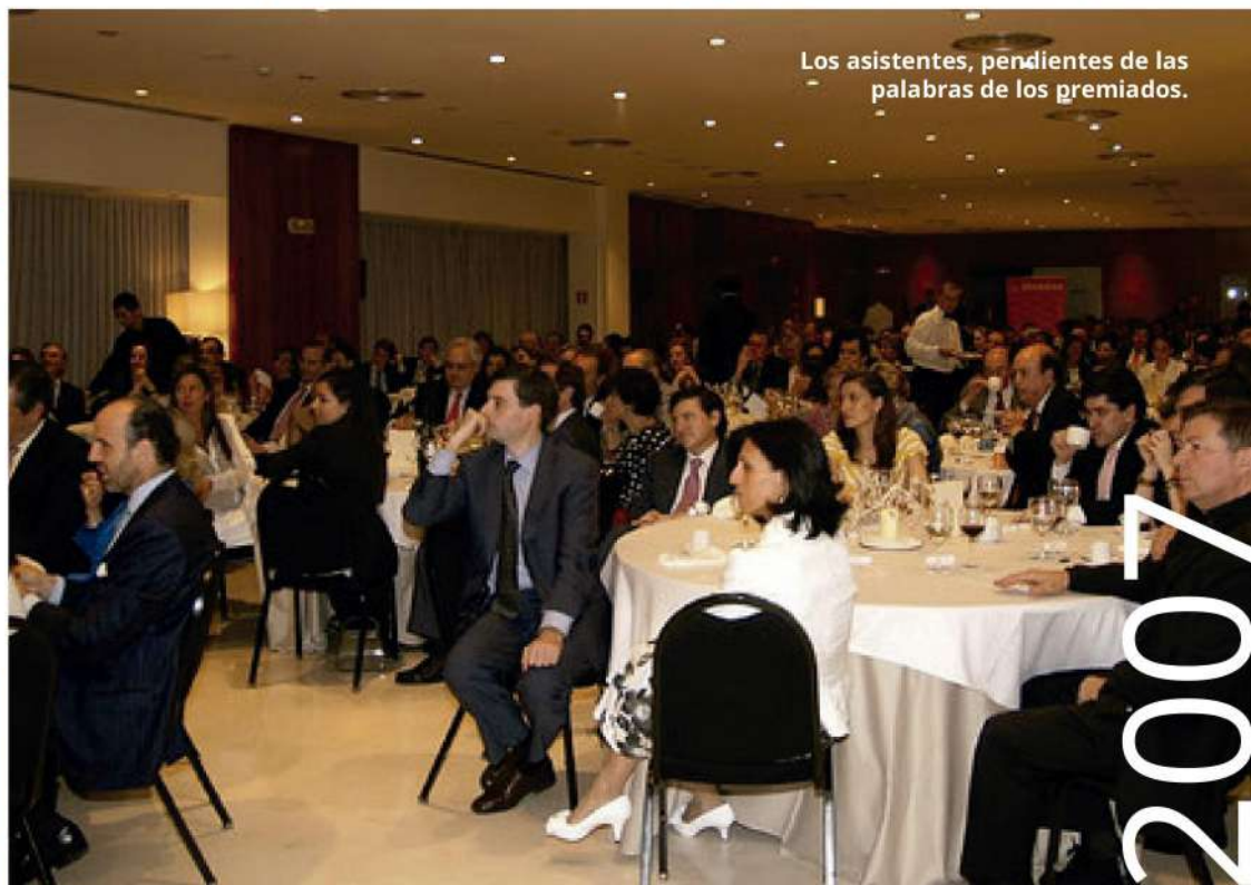
Los asistentes, pendientes de las palabras de los premiados.