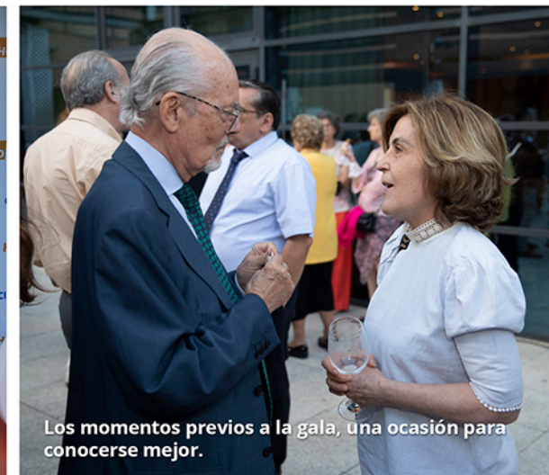
Los momentos previos a la gala, una ocasión para conocerse mejor.