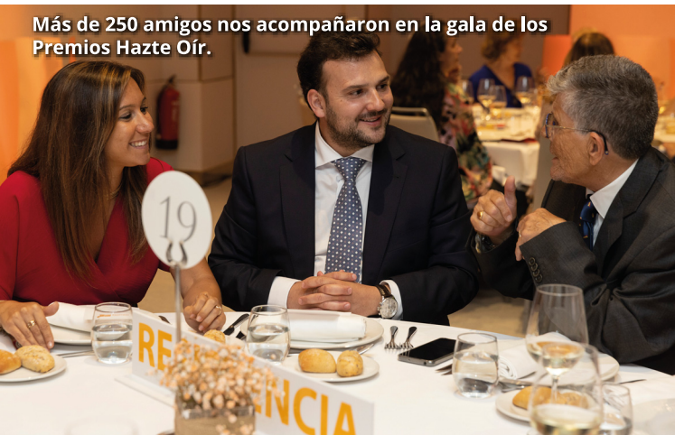
Más de 250 amigos nos acompañaron en la gala de los Premios Hazte Oír.