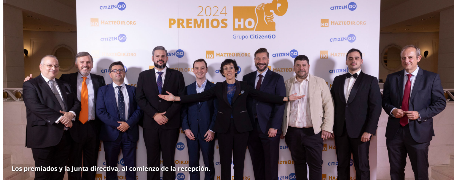
Los premiados y la Junta directiva, al comienzo de la recepción.