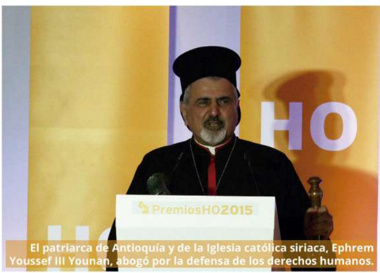
El patriarca de Antioquía y de la Iglesia católica siríaca, Ephrem Youssef III Younan, abogó por la defensa de los derechos humanos.