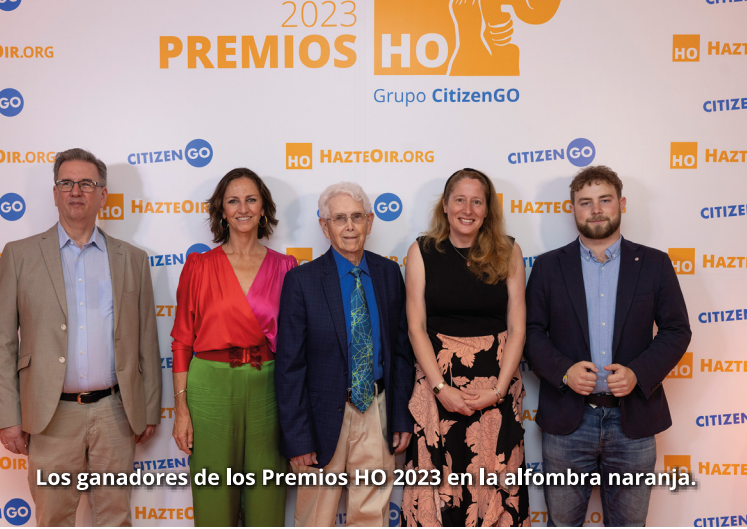
Los ganadores de los Premios HO 2023 en la alfombra naranja.