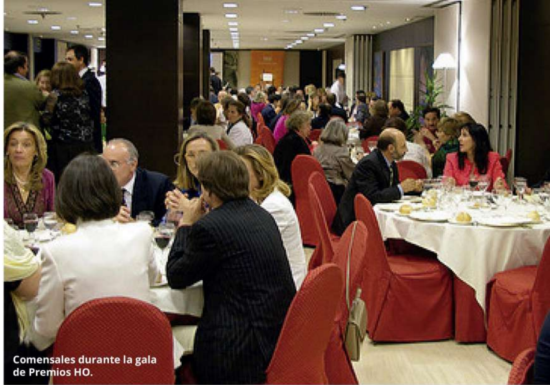
Comensales durante la gala de Premios HO.