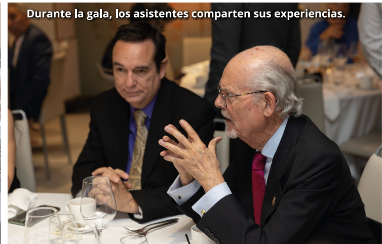
Durante la gala, los asistentes comparten sus experiencias.