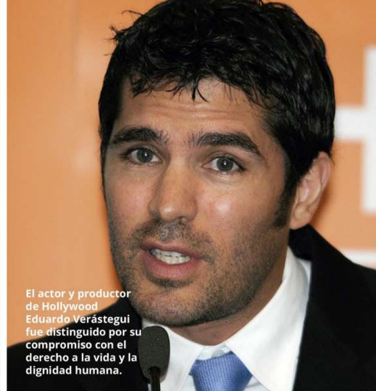
El actor y productor de Hollywood Eduardo Verástegui fue distinguido por su compromiso con el derecho a la vida y la dignidad humana.