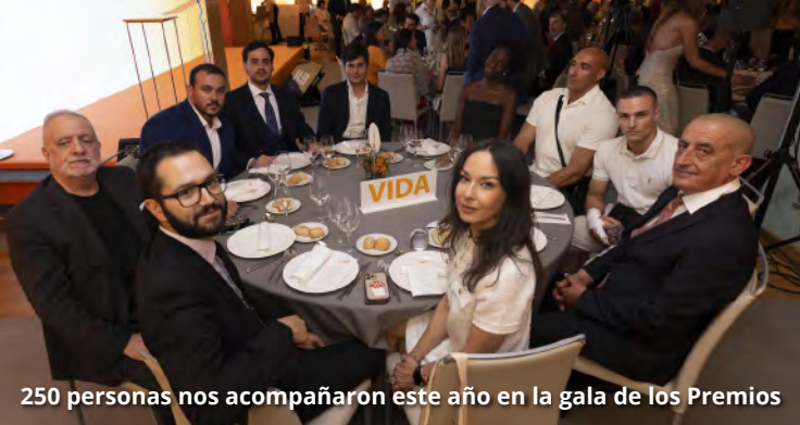
250 personas nos acompañaron este año en la gala de los Premios