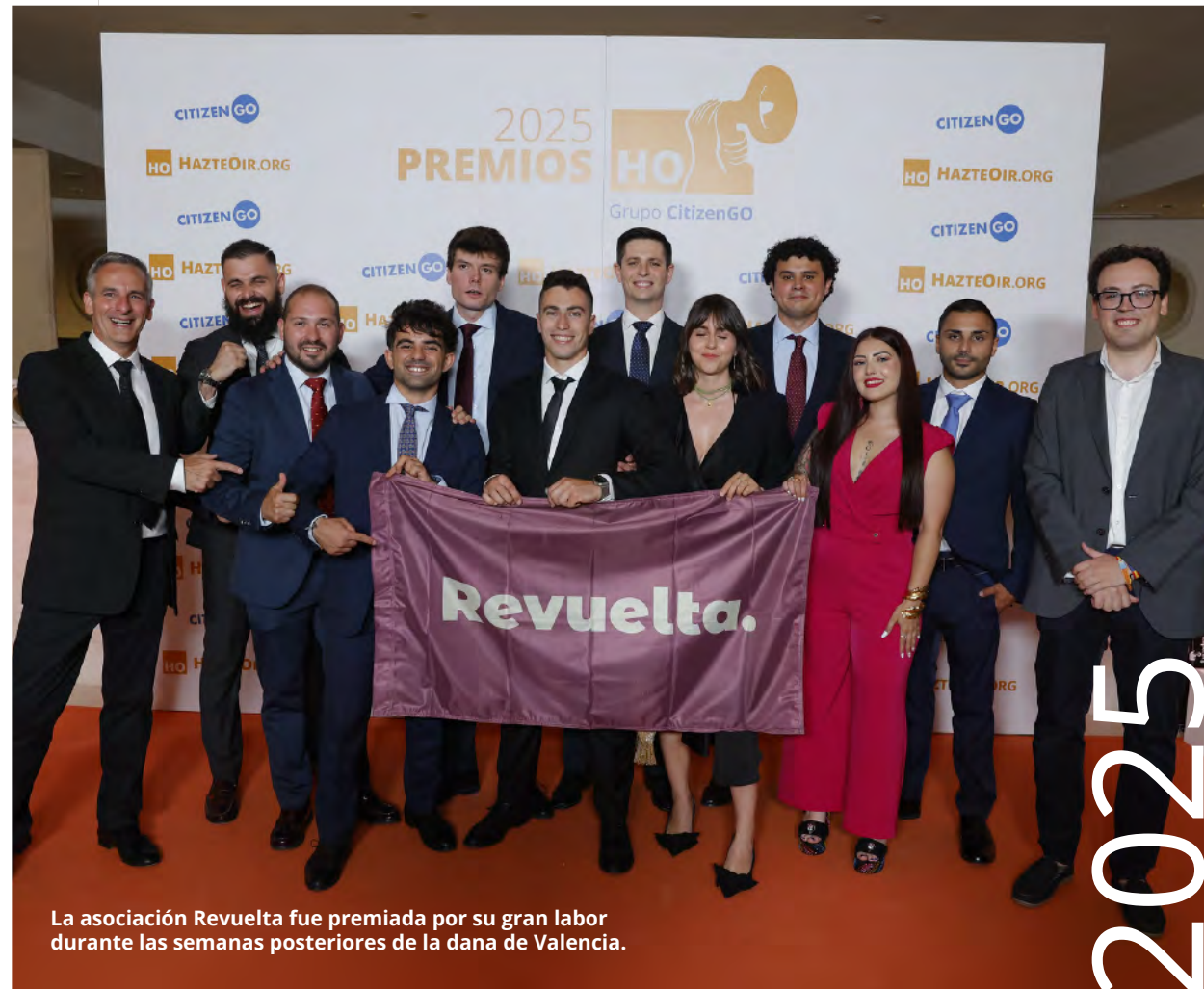
La asociación Revuelta fue premiada por su gran labor durante las semanas posteriores de la dana de Valencia.