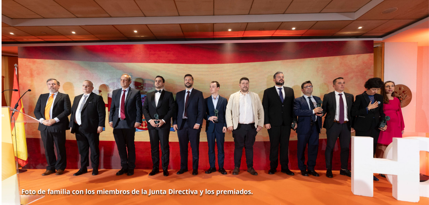
Foto de familia con los miembros de la Junta Directiva y los premiados.