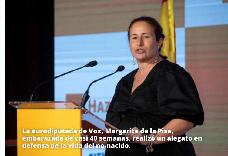
La eurodiputada de Vox, Margarita de la Pisa, embarazada de casi 40 semanas, realizó un alegato en defensa de la vida del no-nacido.