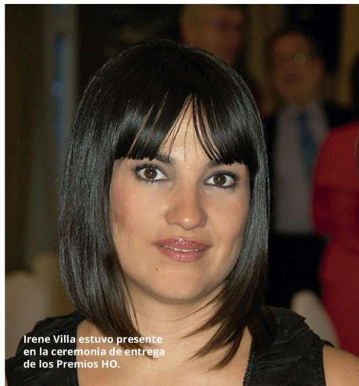
Irene Villa estuvo presente en la ceremonia de entrega de los Premios HO.