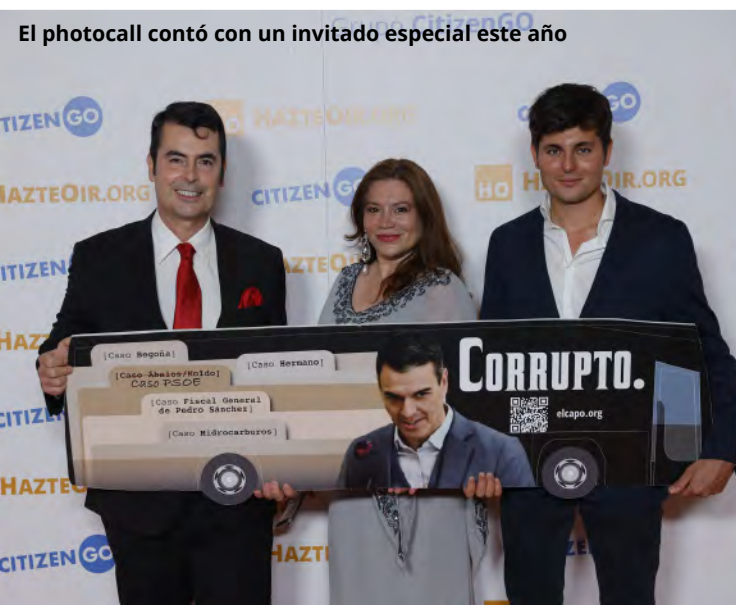
El photocall contó con un invitado especial este año