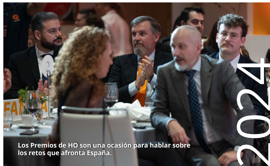
Los Premios de HO son una ocasión para hablar sobre los retos que afronta España.