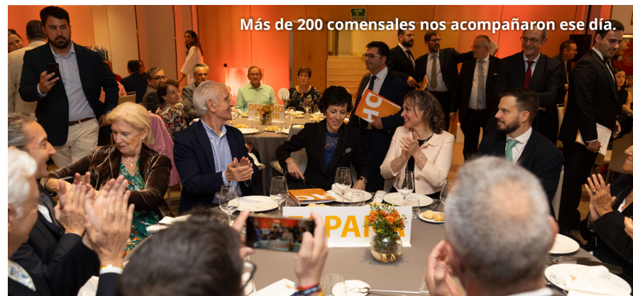
Más de 200 comensales nos acompañaron ese día.