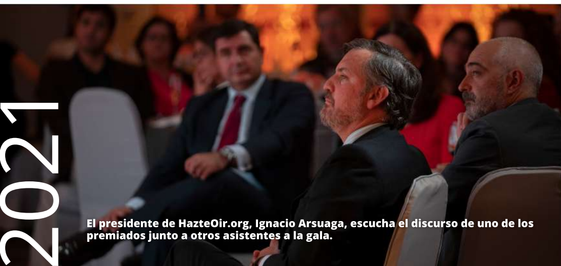
El presidente de HazteOir.org, Ignacio Arsuaga, escucha el discurso de uno de los premiados junto a otros asistentes a la gala.