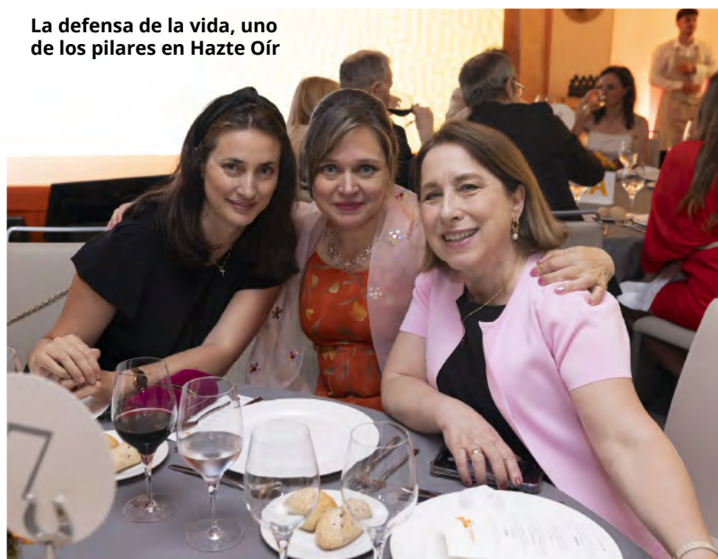
La defensa de la vida, uno de los pilares en Hazte Oír