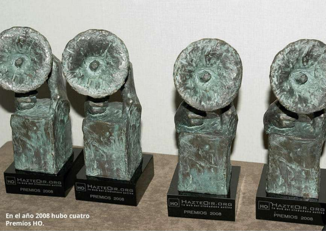
En el año 2008 hubo cuatro Premios HO.