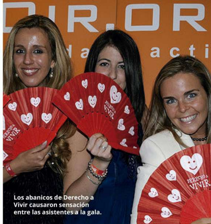
Los abanicos de Derecho a Vivir causaron sensación entre las asistentes a la gala.