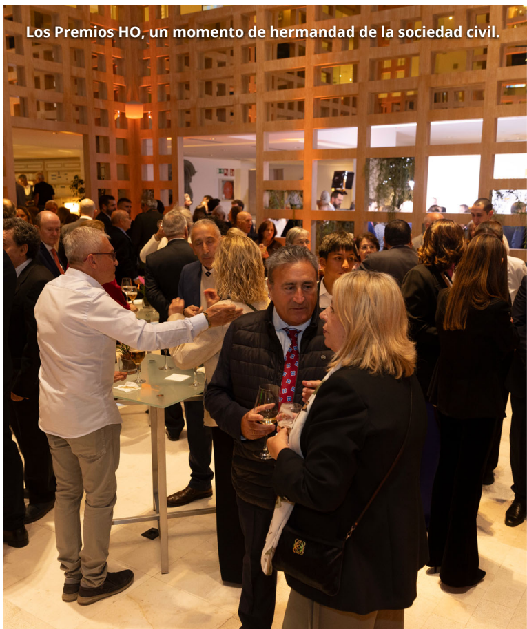
Los Premios HO, un momento de hermandad de la sociedad civil.