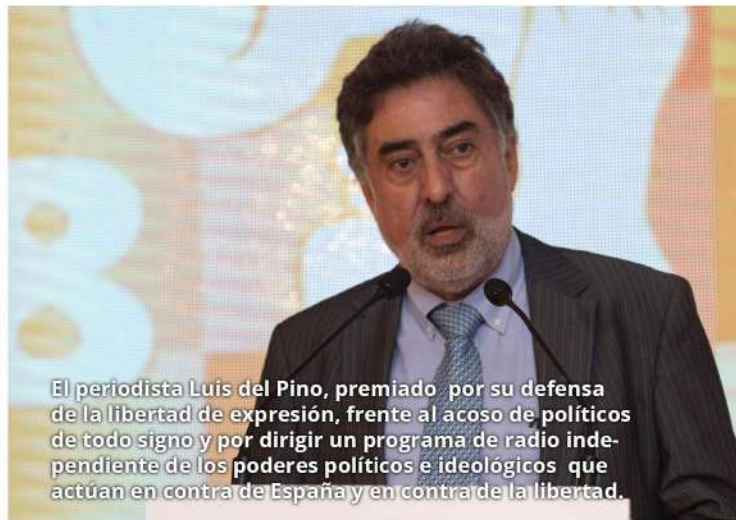
El periodista Luis del Pino, premiado por su defensa de la libertad de expresión, frente al acoso de políticos de todo signo y por dirigir un programa de radio independiente de los poderes políticos e ideológicos que actúan en contra de España y en contra de la libertad.