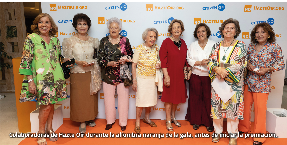
Colaboradoras de Hazte Oír durante la alfombra naranja de la gala, antes de iniciar la premiación.