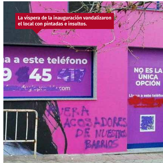
La víspera de la inauguración vandalizaron el local con pintadas e insultos.

Durante el año 2022 hemos sabido que gracias a la labor que se realiza desde el Refugio, 15 mujeres decidieron llevar adelante su embarazo. 15 bebés rescatados, que sepamos, pero seguro han sido muchos más porque muchas madres que ven el teléfono y el QR informativo en la fachada, reciben información por parte de algunos de nuestros socios y entidades colaboradoras como Fundación Madrina.