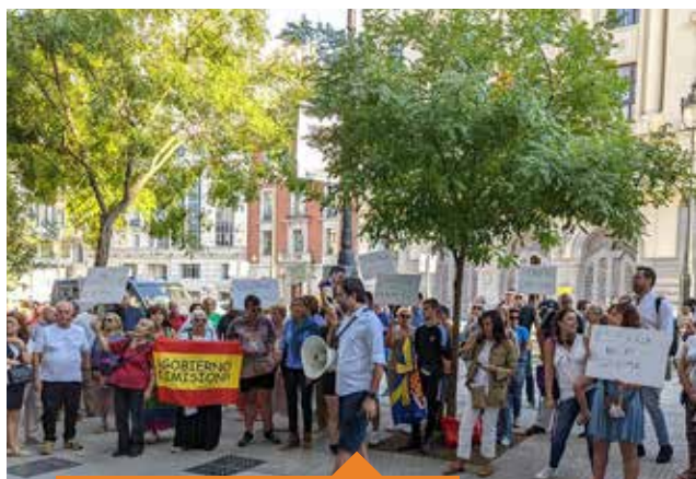
Nos concentramos frente al Ministerio de Igualdad para pedir la dimisión de Irene Montero por defender la pederastia.