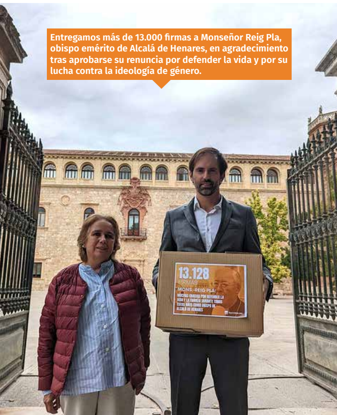
Entregamos más de 13.000 firmas a Monseñor Reig Pla, obispo emérito de Alcalá de Henares, en agradecimiento tras aprobarse su renuncia por defender la vida y por su lucha contra la ideología de género.