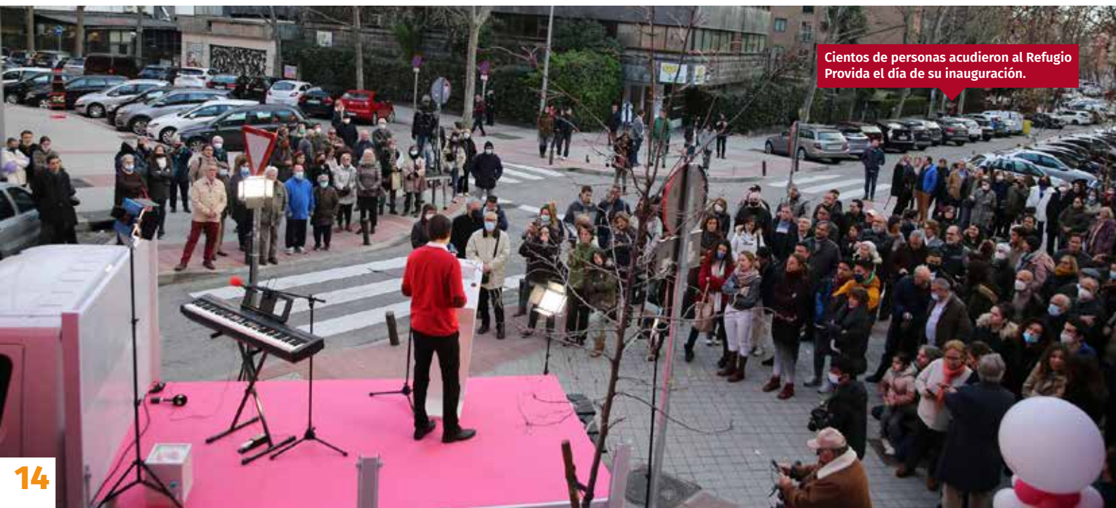
Cientos de personas acudieron al Refugio Provida el día de su inauguración.