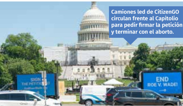
Camiones led de CitizenGO circulan frente al Capitolio para pedir firmar la petición y terminar con el aborto.

La histórica sentencia de la Corte Suprema de Estados Unidos del 24 de junio de 2022, abolió el derecho al aborto en todo el país, que había sido impuesto con la fatídica sentencia de 1973, denominada Roe versus Wade. Todo cambió ese día de San Juan en una sentencia histórica. Desde CitizenGo nos movilizamos para recoger firmas recordando que la Corte Suprema debía velar por los valores y libertades recogidos en la Constitución estadounidense y devolver la autoridad a los estados para que pudiesen proteger la vida ya que el gobierno nacional no lo había hecho. Pusimos camiones en circulación meses antes de la sentencia histórica y antes habíamos participado también con pancartas, lemas y carteles en la Marcha por la Vida que se celebra anualmente en Washington D.C. Enhorabuena a todos los provida por esta gran batalla ganada en Estados Unidos a favor de la vida de todos los seres humanos en el seno materno.