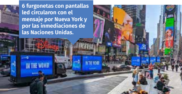
6 furgonetas con pantallas led circularon con el mensaje por Nueva York y por las inmediaciones de las Naciones Unidas.

CitizenGO acudió a la sede de las Naciones Unidas en Nueva York a decir alto y claro a todos los delegados de la Cumbre de la Mujer CSW 66 que los derechos de las mujeres empiezan en el vientre materno y que toda vida humana hay que defenderla desde el primer momento. También nos opusimos con fuerza a los intentos de imponer más aborto, más ideología de género y más sexualización en la educación de los niños. Entregamos 20.000 firmas a los ministros de Asuntos Exteriores nos reunimos con los delegados de Naciones Unidas, de Hungría y Colombia, que podían con su voto revertir los intentos de llegar a conclusiones contrarias al derecho a la vida y a la familia. Además contratamos publicidad con camiones led, anuncios en cuatro periódicos y colocación de carteles en Nueva York para hacer más presión y hacernos oír.