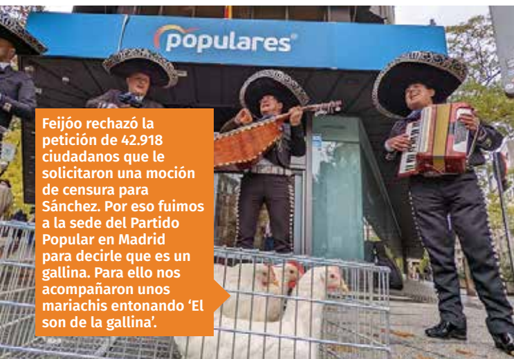
Feijóo rechazó la petición de 42.918 ciudadanos que le solicitaron una moción de censura para Sánchez. Por eso fuimos a la sede del Partido Popular en Madrid para decirle que es un gallina. Para ello nos acompañaron unos mariachis entonando 'El son de la gallina'.