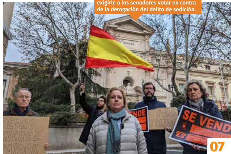
Nos concentramos frente al Senado para exigirle a los senadores votar en contra de la derogación del delito de sedición.