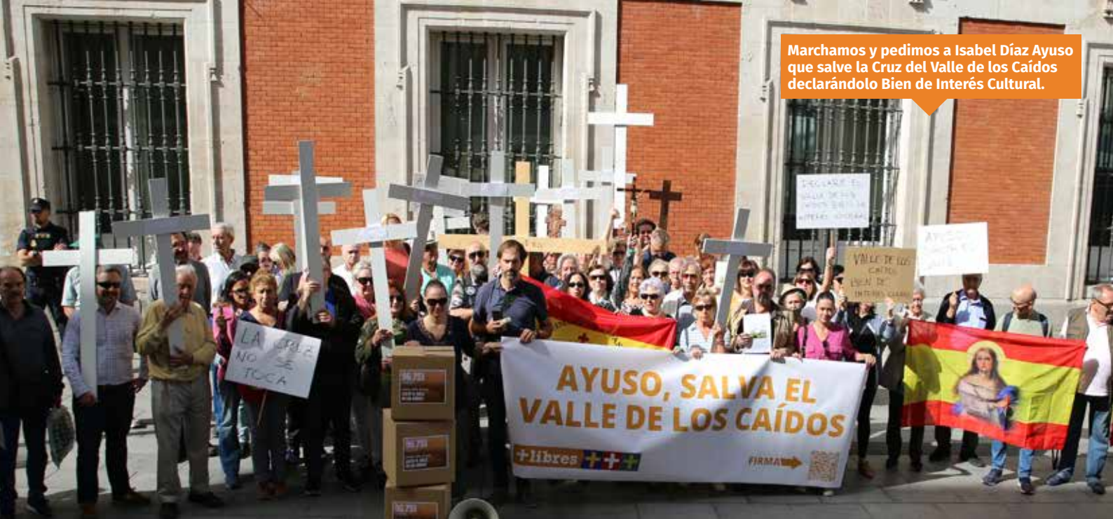
Marchamos y pedimos a Isabel Díaz Ayuso que salve la Cruz del Valle de los Caídos declarándolo Bien de Interés Cultural.