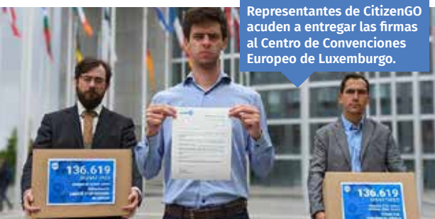
Representantes de CitizenGO acuden a entregar las firmas al Centro de Convenciones Europeo de Luxemburgo.

El 9 de diciembre de 2021, la Comisión Europea propuso ampliar la lista de delitos de la UE incluyendo la incitación al odio y los delitos de odio al artículo 83, apartado 1, del Tratado de Funcionamiento de la Unión Europea. Pero ya sabíamos lo que eso significaba realmente pues son conceptos de los que se puede abusar con facilidad. De hecho, la Comisión Europea no había logrado dar una definición de lo que buscaba criminalizar como discurso de odio y por esa razón, le pedimos que defendiera la libertad de expresión y votara en contra de la ampliación de delitos sabiendo que la votación sería en una sesión de junio de 2022. Acudimos a Luxemburgo a entregar más de 136.000 firmas en persona, en el Centro de Convenciones Europeo.