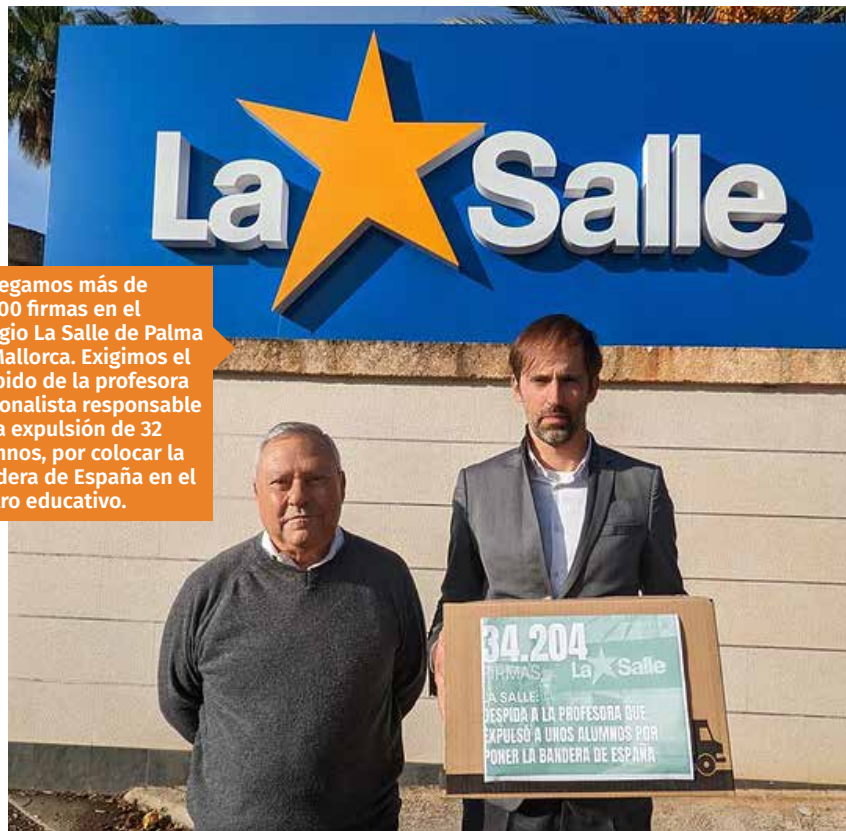
Entregamos más de 34.200 firmas en el colegio La Salle de Palma de Mallorca. Exigimos el despido de la profesora nacionalista responsable de la expulsión de 32 alumnos, por colocar la bandera de España en el centro educativo.