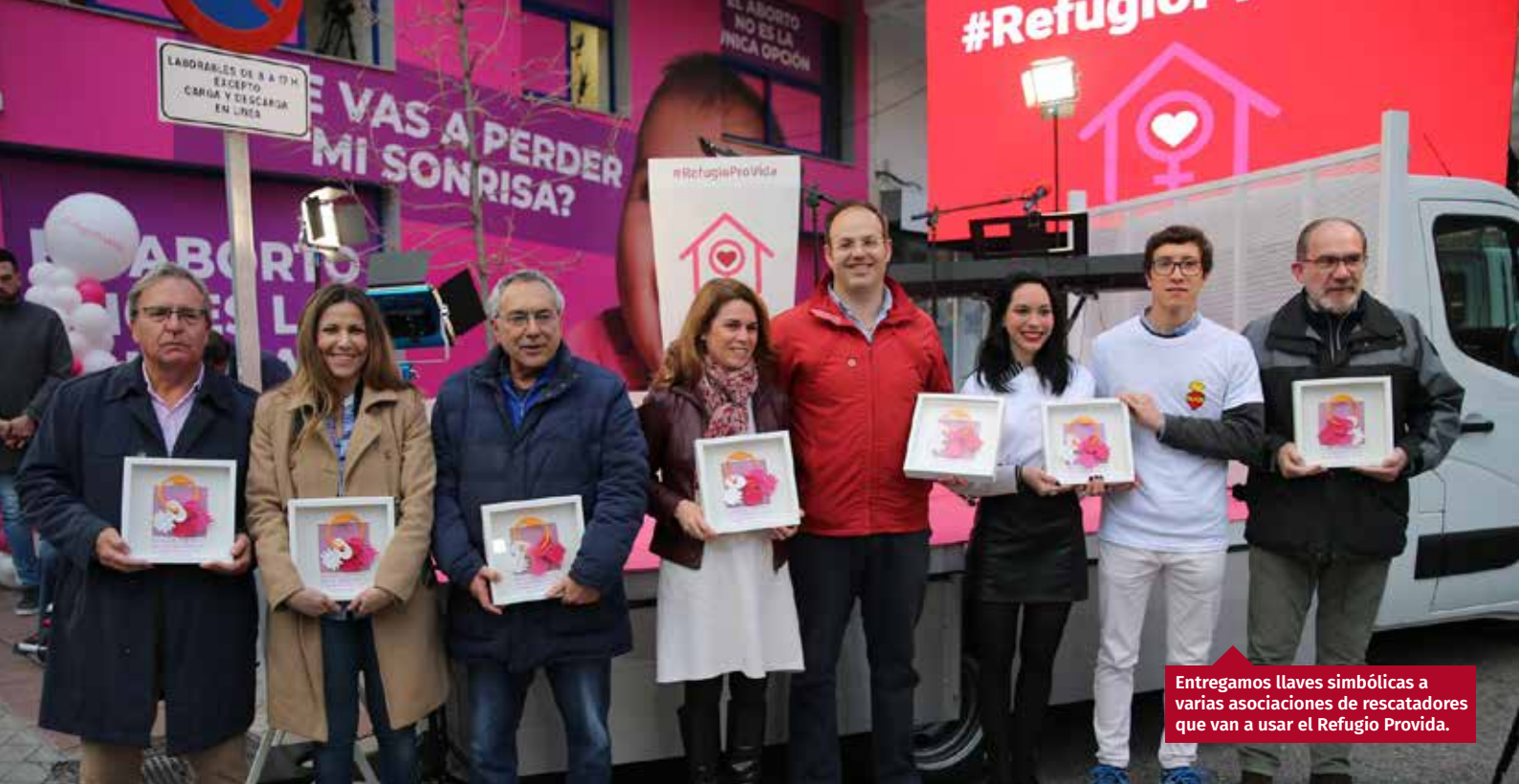
Entregamos llaves simbólicas a varias asociaciones de rescatadores que van a usar el Refugio Provida.