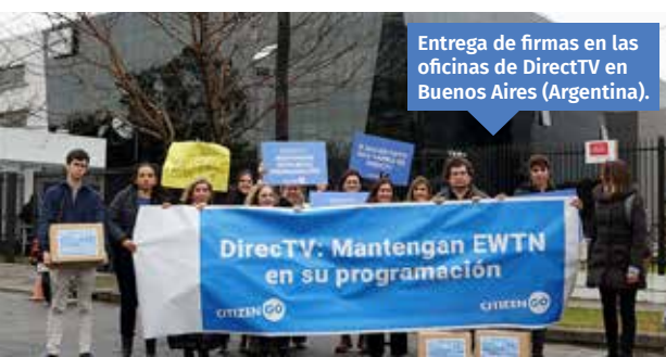
Entrega de firmas en las oficinas de DirectTV en Buenos Aires (Argentina).

El canal EWTN ofrece un gran servicio al mundo cristiano, hay millones de personas que se sienten acompañadas a través de todos sus programas televisivos. Sin embargo, DirectTV había informado a sus usuarios que quitarían EWTN de su programación a partir del mes julio del 2022 para hispanoamérica. Pero los televidentes católicos se movilizaron y animaron a la petición en CitizenGO. La petición consiguió casi 70.000 firmas en poco tiempo y las entregamos en persona el 27 de julio en las oficinas de DirectTV.