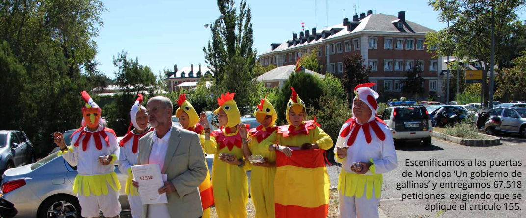
Escenificamos a las puertas de Moncloa 'Un gobierno de gallinas' y entregamos 67.518 peticiones exigiendo que se aplique el artículo 155.