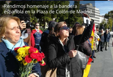
Rendimos homenaje a la bandera española en la Plaza de Colón de Madrid