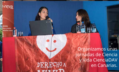
Organizamos unas jornadas de Ciencia y Vida CienciaDAV en Canarias.