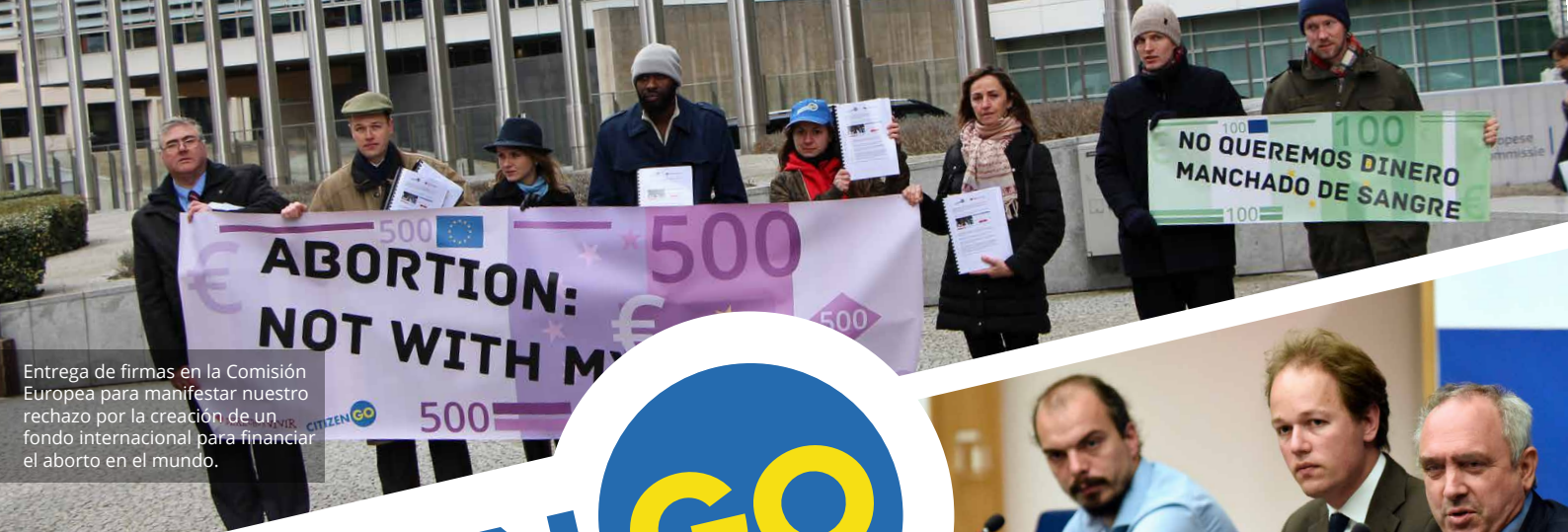
Entrega de firmas en la Comisión Europea para manifestar nuestro rechazo por la creación de un fondo internacional para financiar el aborto en el mundo.