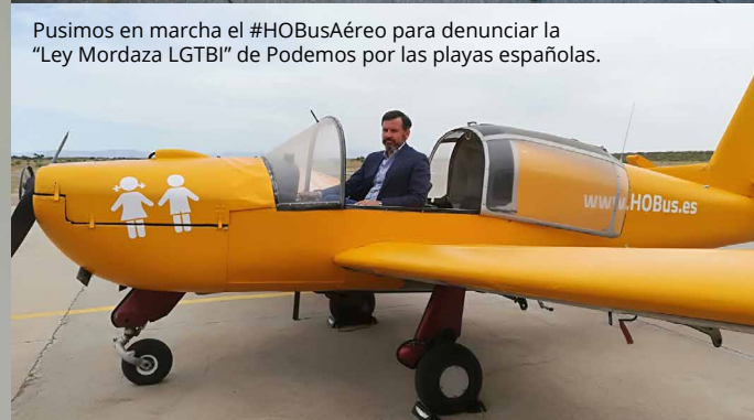
Pusimos en marcha el #HOBusAéreo para denunciar la "Ley Mordaza LGTBI" de Podemos por las playas españolas.