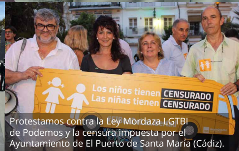
Protestamos contra la Ley Mordaza LGTBI de Podemos y la censura impuesta por el Ayuntamiento de El Puerto de Santa María (Cádiz).