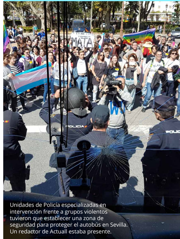
Unidades de Policía especializadas en intervención frente a grupos violentos tuvieron que establecer una zona de seguridad para proteger el autobús en Sevilla. Un redactor de Actual estaba presente.