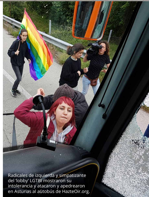
Radicales de izquierda y simpatizante del 'lobby' LGBTI mostraron su intolerancia y atacaron y apedrearon en Asturias al autobús de HazteOir.org.

Su recorrido por toda España estuvo lleno de impedimentos por parte de políticos, violentos y miembros de los grupos LGBTI, que veían en el lema 'Los niños tienen pene y las niñas tienen vulva. Que no te engañen. Si naces hombre, eres hombre. Si eres mujer, seguirás siéndolo. No permitas que manipulen a tus hijos en el colegio. Infórmate con el libro que no quieren que leas' un peligroso ataque homófobo.