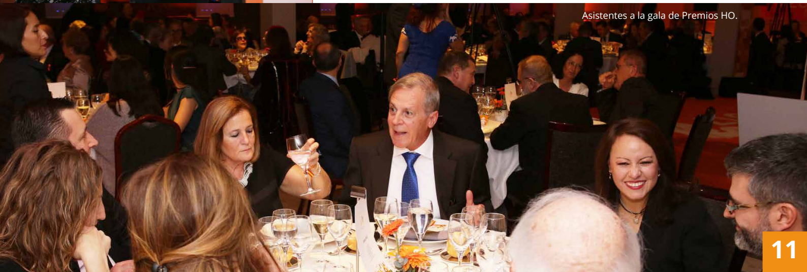
Asistentes a la gala de Premios HO.

En el transcurso de la gala 300 asistentes aplaudieron la labor de los galardonados por defender la familia, la vida, la libertad y la unidad de España.