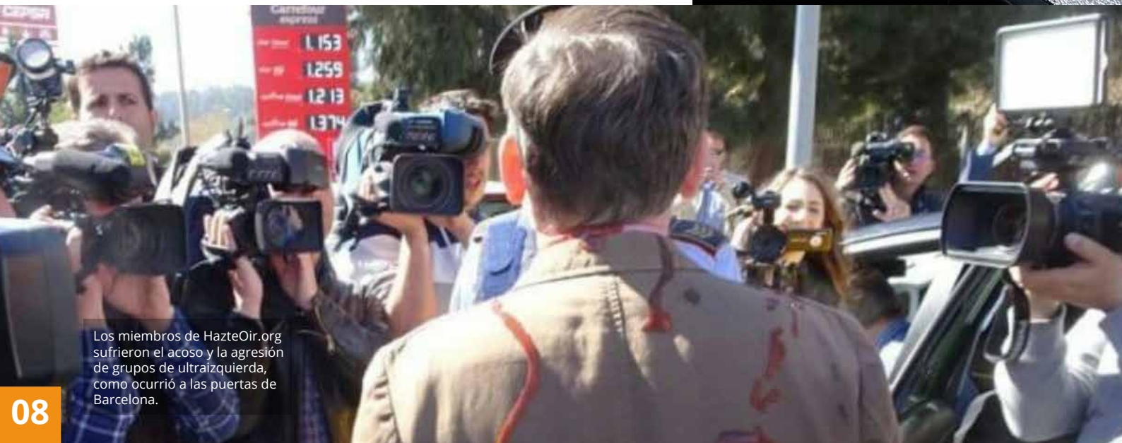
Los miembros de HazteOir.org sufrieron el acoso y la agresión de grupos de ultrazquierda, como ocurrió a las puertas de Barcelona.