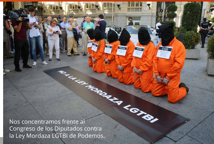
Nos concentramos frente al Congreso de los Diputados contra la Ley Mordaza LGTBI de Podemos.