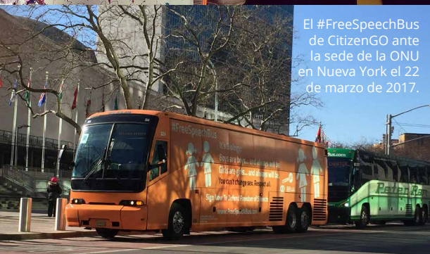
El #FreeSpeechBus de CitizenGO ante la sede de la ONU en Nueva York el 22 de marzo de 2017.