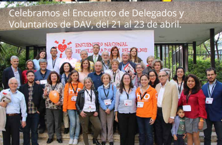
Celebramos el Encuentro de Delegados y Voluntarios de DAV, del 21 al 23 de abril.