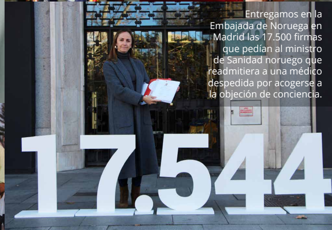
Entregamos en la Embajada de Noruega en Madrid las 17.500 firmas que pedían al ministro de Sanidad noruego que readmitiera a una médico despedida por acogerse a la objeción de conciencia.