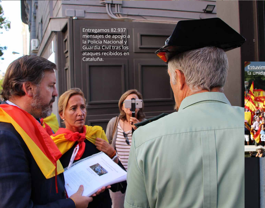
Entregamos 82.937 mensajes de apoyo a la Policía Nacional y Guardia Civil tras los ataques recibidos en Cataluña.