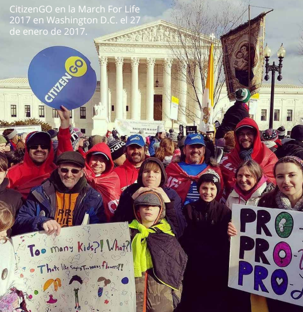
CitizenGO en la March For Life 2017 en Washington D.C. el 27 de enero de 2017.