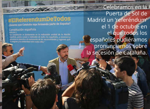
Celebramos en la Puerta de Sol de Madrid un 'referéndum' el 1 de octubre en el que todos los españoles pudiéramos pronunciamos sobre la secesión de Cataluña.