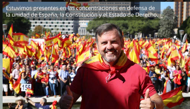
Estuvimos presentes en las concentraciones en defensa de la unidad de España, la Constitución y el Estado de Derecho.