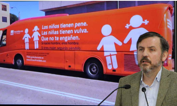
Sacamos a las calles españolas "el bus que no miente".