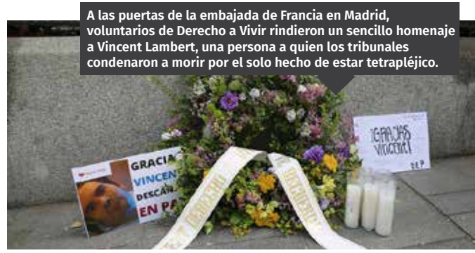
A las puertas de la embajada de Francia en Madrid, voluntarios de Derecho a Vivir rindieron un sencillo homenaje a Vincent Lambert, una persona a quien los tribunales condenaron a morir por el solo hecho de estar tetrapléjico.