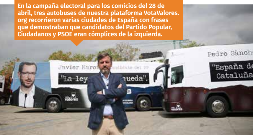
En la campaña electoral para los comicios del 28 de abril, tres autobuses de nuestra plataforma VotaValores.org recorrieron varias ciudades de España con frases que demostraban que candidatos del Partido Popular, Ciudadanos y PSOE eran cómplices de la izquierda.