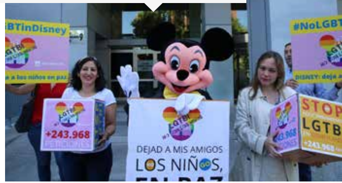
Sumándose a una iniciativa de CitizenGO, voluntarios de HazteOir.org entregaron 243.968 firmas en la sede de la compañía Disney en Madrid para exigir el fin del adoctrinamiento LGTB en sus parques de ocio infantiles.