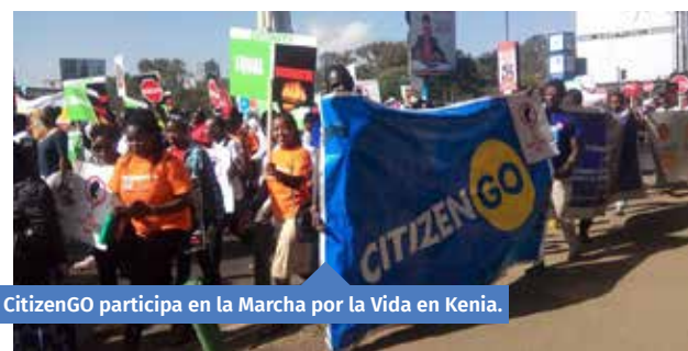
CitizenGO participa en la Marcha por la Vida en Kenia.