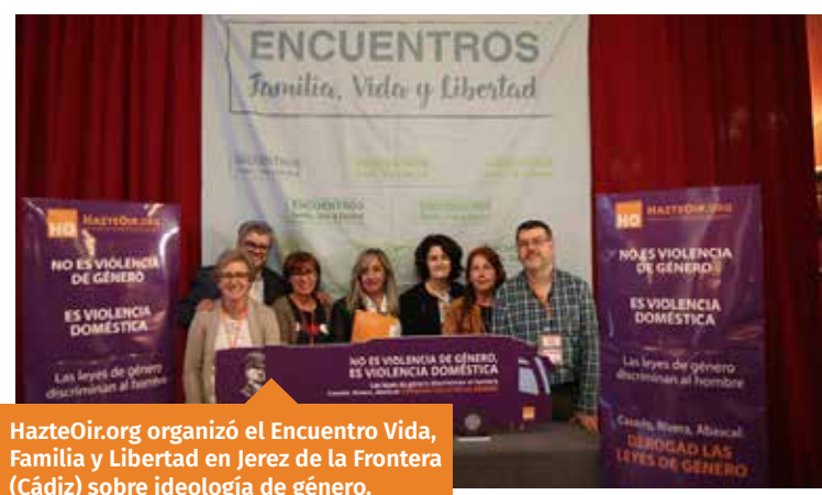
HazteOir.org organizó el Encuentro Vida, Familia y Libertad en Jerez de la Frontera (Cádiz) sobre ideología de género.