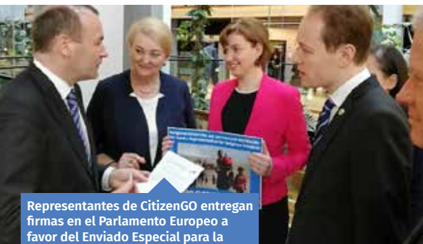
Representantes de CitizenGO entregan firmas en el Parlamento Europeo a favor del Enviado Especial para la promoción de la libertad religiosa.