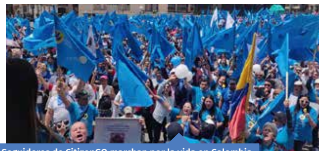
Seguidores de CitizenGO marchan por la vida en Colombia.