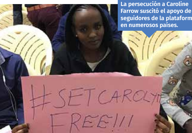
La persecución a Caroline Farrow suscitó el apoyo de los seguidores de la plataforma en numerosos países.