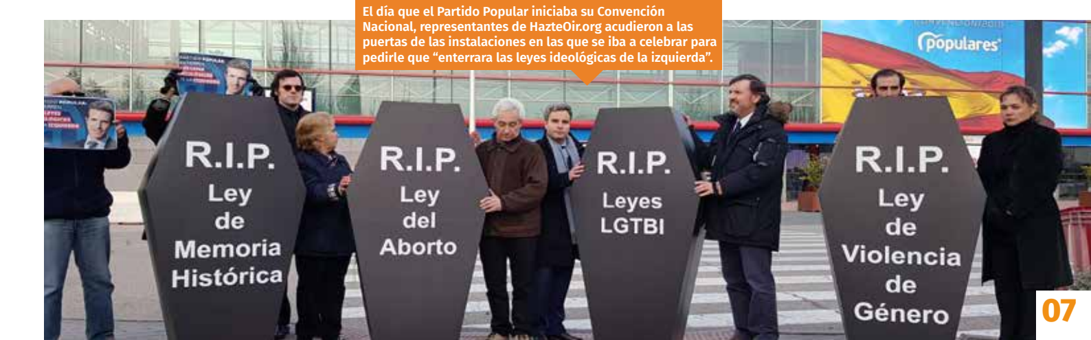
El día que el Partido Popular iniciaba su Convención Nacional, representantes de HazteOir.org acudieron a las puertas de las instalaciones en las que se iba a celebrar para pedirle que "enterrara las leyes ideológicas de la izquierda".