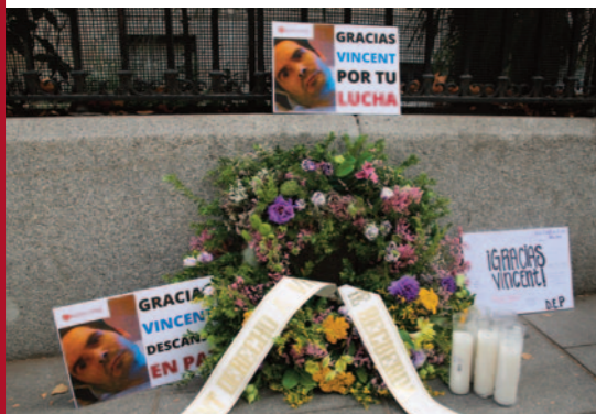
Imagen de la corona de flores depositada ante la Embajada de Francia en Madrid en homenaje a Vincent Lambert.

Han sido unos meses duros en la batalla de la defensa de la vida. El día que en Francia se dejó morir de hambre y sed a Vincent Lambert fue un revés para quienes defendemos esta causa. No obstante, Derecho a Vivir no bajó los brazos en su compromiso y organizó, junto a CitizenGO, actos y vigiliass en memoria de Vincent en varias ciudades del mundo, entre otras en París y Londres. Además, cuando se confirmó el triste desenlace, se hizo una ofrenda de una corona de flores en la Embajada de Francia en Madrid.