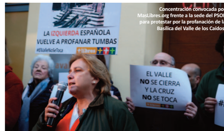
Concentración convocada por MasLibres.org frente a la sede del PSOE para protestar por la profanación de la Basílica del Valle de los Caídos.

pesar de que, gracias a HO, ha recibido miles de correos electrónicos, cartas físicas y cientos de llamadas telefónicas preguntándole. Una vez certificada la renuncia de Pablo Casado a defender nuestros valores, emprendimos una labor informativa exhaustiva sobre lo que piensa el PP acerca de determinados asuntos e iniciamos la campaña #PPPromesasPerdidas. En nuestro próximo boletín te ampliaré la información sobre esta iniciativa.