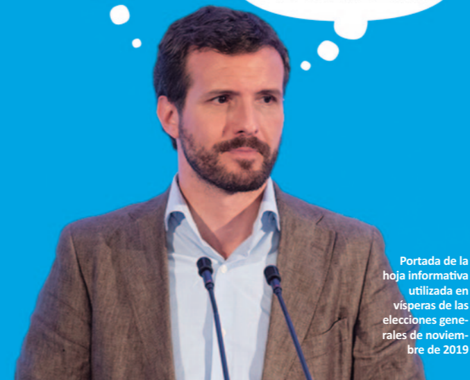
Portada de la hoja informativa utilizada en vísperas de las elecciones generales de noviembre de 2019

pesar de que, gracias a HO, ha recibido miles de correos electrónicos, cartas físicas y cientos de llamadas telefónicas preguntándole. Una vez certificada la renuncia de Pablo Casado a defender nuestros valores, emprendimos una labor informativa exhaustiva sobre lo que piensa el PP acerca de determinados asuntos e iniciamos la campaña #PPPromesasPerdidas. En nuestro próximo boletín te ampliaré la información sobre esta iniciativa.