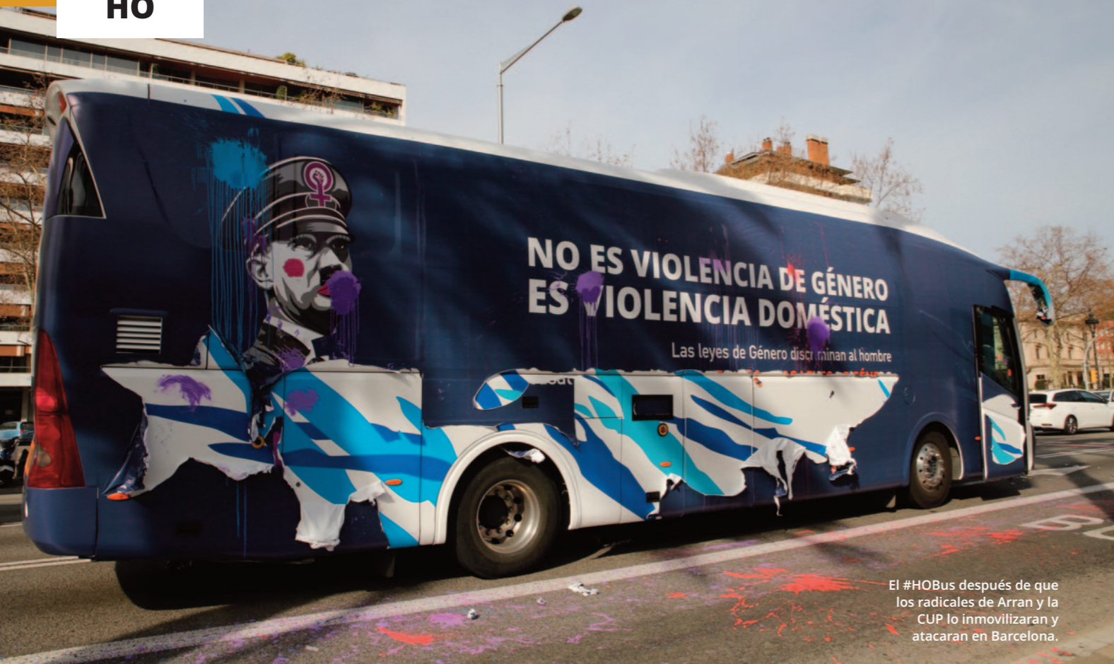
El #HOBUS después de que los radicales de Arran y la CUP lo inmovilizaran y atacaran en Barcelona.