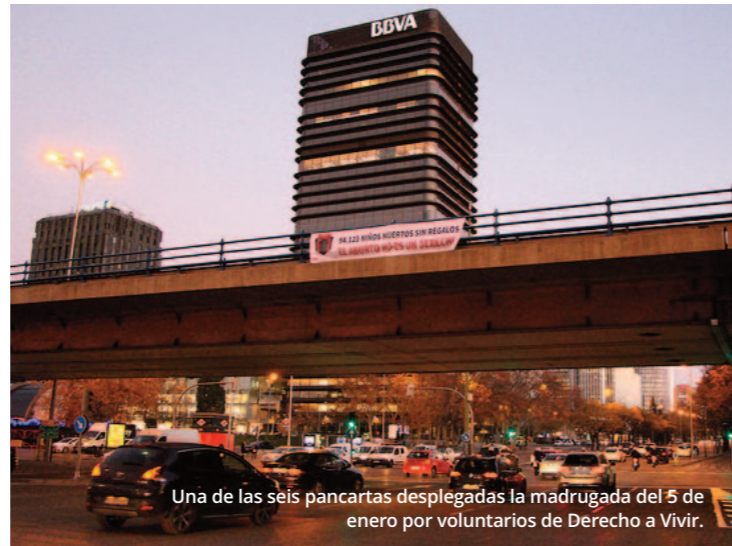
Una de las seis pancartas desplegadas la madrugada del 5 de enero por voluntarios de Derecho a Vivir.