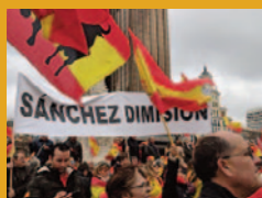
HO pide en Colón la dimisión de Sánchez