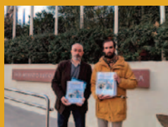
MasLibres.org, en la sede del Parlamento Europeo para defender la libertad religiosa en el mundo

que tuvo lugar en la plaza de Colón de Madrid el domingo 10 de febrero portando una pancarta de gran tamaño que decía: "Sánchez dimisión". Nuestro mensaje fue portada en destacados periódicos. Pocos días después, el gobierno de Sánchez anunció la cita con las urnas. ¡Gracias por hacerlo posible!