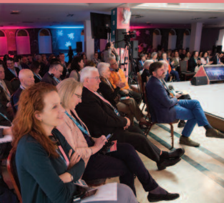
Asistentes al I Congreso Internacional sobre Género, Sexo y Educación.