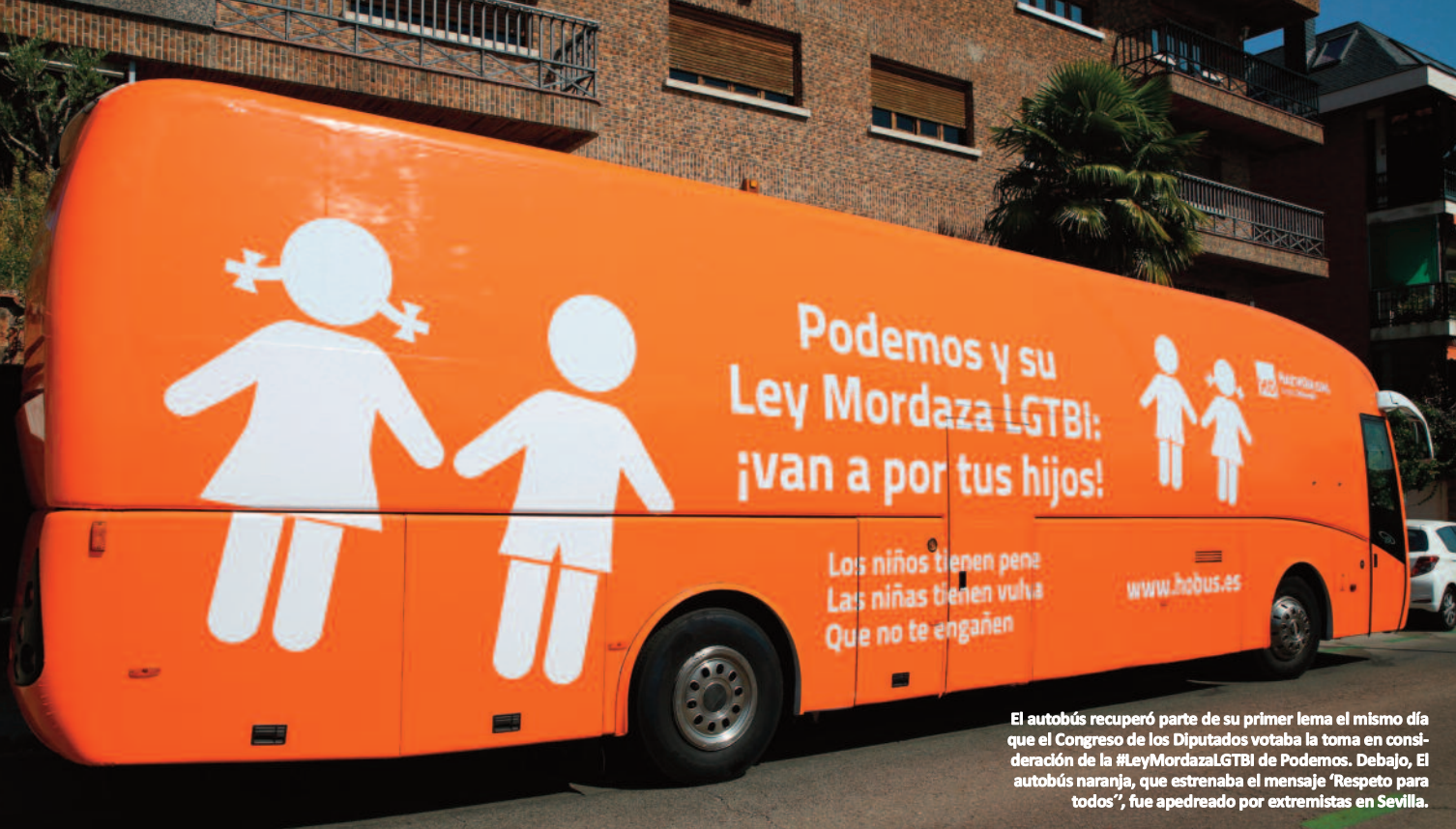
El autobús recuperó parte de su primer lema el mismo día que el Congreso de los Diputados votaba la toma en consideración de la #LeyMordazaLGTBI de Podemos. Debajo, El autobús naranja, que estrenaba el mensaje 'Respeto para todos', fue apedreado por extremistas en Sevilla.