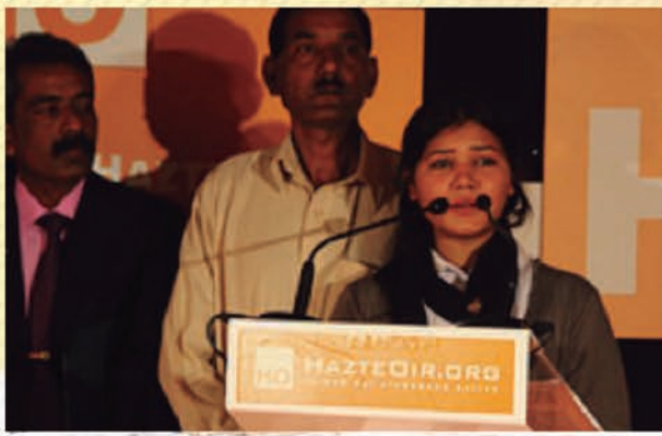
A la izquierda, el marido de Asia Bibi y una de sus hijas, que recogieron el Premio HazteOir.org en 2012, concedido a la cristiana paquistaní encarcelada