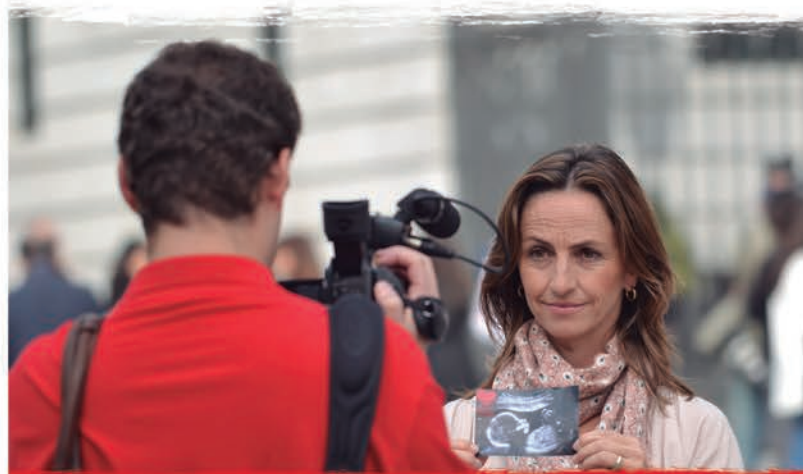
17 de octubre: Voluntarios entregan ecografías a las puertas del Congreso. La portavoz de Derecho a Vivir señala que para el aborto, como para cualquier otra intervención quirúrgica, "no hay consentimiento informado si no es veraz y completo".