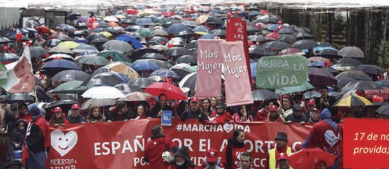
17 de noviembre: La lluvia no achantó a los ciudadanos provida; la IV Marcha por la Vida resultó multitudinaria.