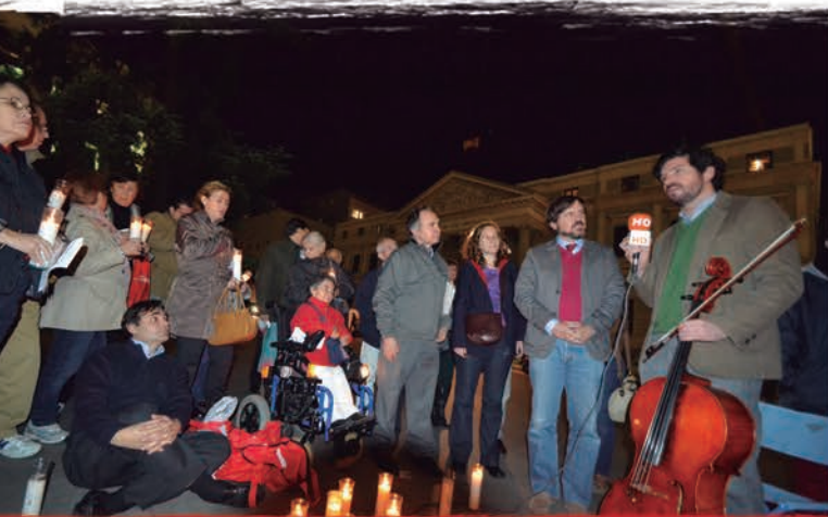
13 de noviembre: Velada por la Vida en el Congreso de los Diputados, convocada por Derecho a Vivir, como 'Les Veilleurs' de Francia