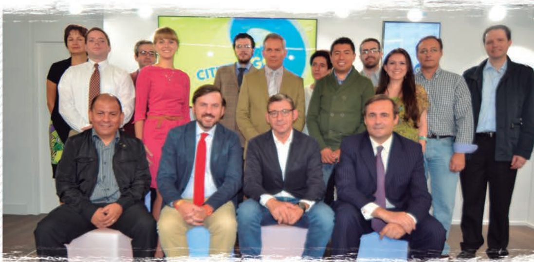
El equipo de la nueva plataforma CitizenGO. Debajo, dos momentos de la bendición de la nueva sede.